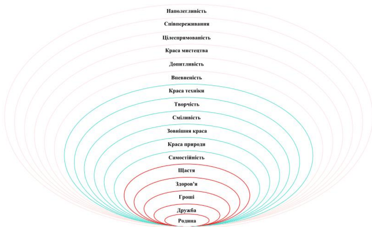
Рис. 1 „Поле цінностей” сучасного дошкільника

На рисунку 1 представлено модель ієрархічної будови „поля цінностей” дітей старшого дошкільного віку.