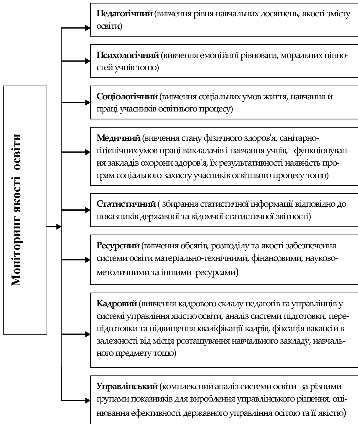
Рис. 2. Основні напрями досліджень в структурі комплексного моніторингу якості освіти [5, с. 88].

Моніторинг якості освіти як оцінна технологія та інформаційна система освітньої сфери покликана виконувати низку завдань, спрямованих на удосконалення освітнього процесу та управління якістю освіти як у цілому, так і окремих її компонентів. Пріоритетними, стратегічними завданнями моніторингу в освіті, на нашу думку, є: