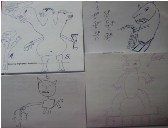
Рис. 1. Приклади зображень практик оцінювання влади як агресивної Амбівалентність влади – 10% мал.

Толерантність влади (миролюбність) – 12% мал. На малюнках це виявляється через зображення посмішок, добрих істот і миролюбних тварин, гарної погоди, а також через образ бажаної влади тощо (див. – рис. 2). Цікаво, що при цьому на малюнках доволі часто відсутні люди, що може свідчити як про те, що це певний ідеальний, неіснуючий образ влади (такої, як її хочуть бачити люди), так і про тенденцію уникання взаємодії із владою.