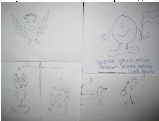
Рис. 2. Приклади практик оцінювання влади як миролюбної

Толерантність влади (миролюбність) – 12% мал. На малюнках це виявляється через зображення посмішок, добрих істот і миролюбних тварин, гарної погоди, а також через образ бажаної влади тощо (див. – рис. 2). Цікаво, що при цьому на малюнках доволі часто відсутні люди, що може свідчити як про те, що це певний ідеальний, неіснуючий образ влади (такої, як її хочуть бачити люди), так і про тенденцію уникання взаємодії із владою.