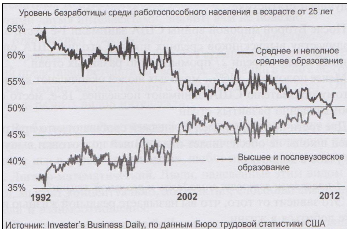
Рис. 1. Динаміка безробіття в США, відповідно до освітнього рівня.

Перш за все, засновник компанії Rich Dad Роберт Кійосакі звертає увагу на переміщені акцентів з площини працевлаштування дорослої людини за фахом у площину підвищення своєї фінансової грамотності і цінності як фахівця.