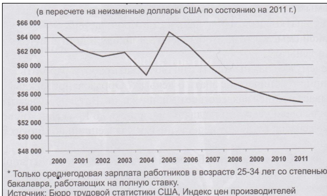
Рис. 2. Динаміка зміни середньої річної заробітної плати фахівців з вищою освітою в США.

Розглянемо основні моменти освіти дорослої людини, яка вже має певний життєвий досвід та освіту. За основу своїх рекомендацій Р.Кійосакі використовував практичний досвід провідних фахівців (людей які на досягли успіху як в кар'єрі/бізнесі так і в інших сферах життєдіяльності людини) та надбання теорій Річарда Бакмінстера Фуллера, Едгара Дейла та інших дослідників.