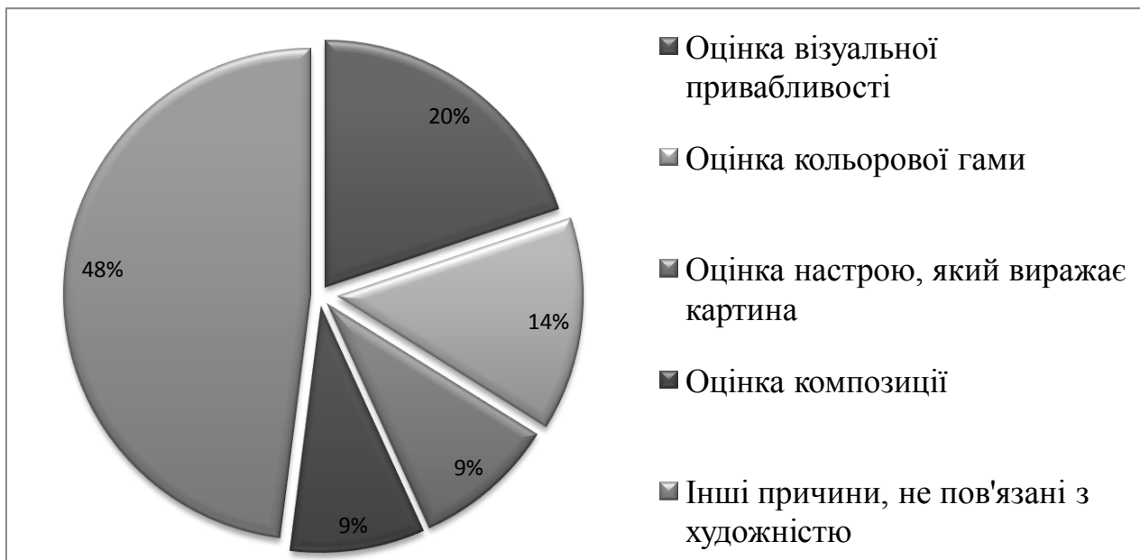
Рис. 2. Співвідношення оцінки студентами художніх ознак у загальному враженні від картини І. Айвазовського «Дев'ятий вал» у другому зрізі

гармонійність організації елементів художнього образу на площині, колір та ін., тоді як у другому зрізі значущий вплив на загальне враження від твору здійснює також і оцінка багатозначності художнього образу.