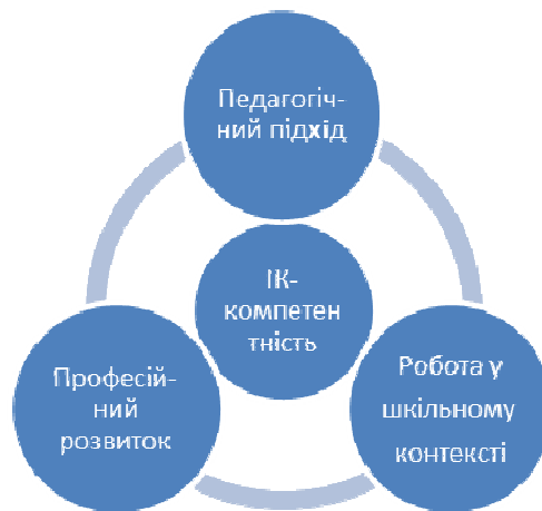
Рис.2. Модель ІК-компетентності вчителя Нідерландів

Зупинимося детальніше на кожному підході.