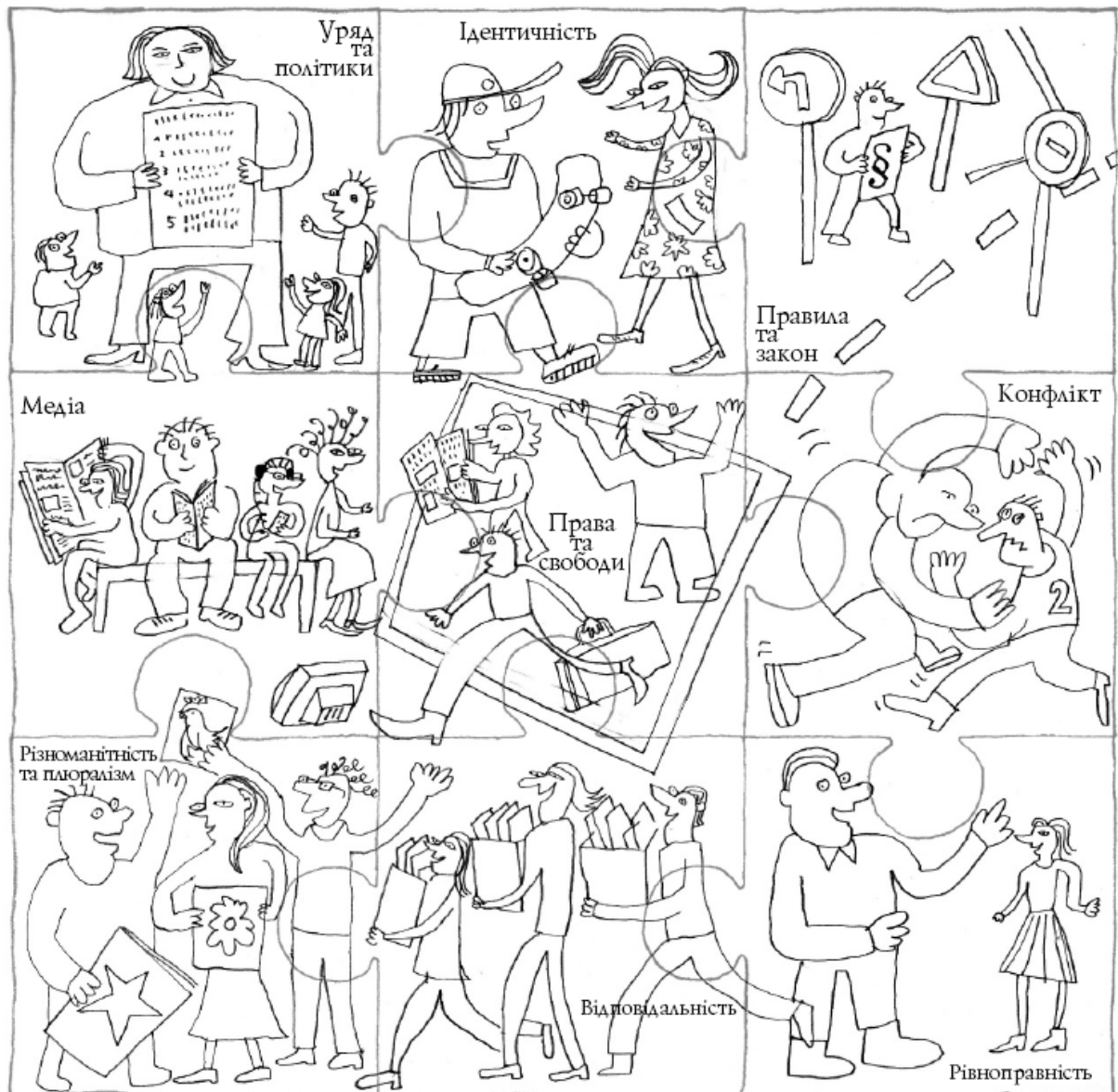
Рис. 3. Пазл-ілюстрація до серії посібників Ради Європи з питань освіти для демократичного громадянства. Автор - П. Віксман, 2009 р. [7,16].

Європи передають взаємозв'язки між поняттями та їх поєднання у навчальних темах (Рис.3) [7,16].