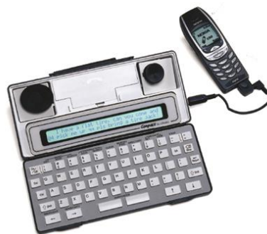
Мал. 2. Еволюція пристроїв ТТУ

Відео-зв'язок (відео-конференції) дозволяють двом чи більше учасникам взаємодіяти в режимі реального часу засобами відео- та аудіо-зв'язку. Досягнення в галузі відео-технологій суттєво розширили їх доступність та можливості використання в дистанційному навчанні. При візуальному контакті учителя з учнями досягається якісно новий рівень взаємодії: відео-зв'язок забезпечує інтерактивне навчання, з можливістю як вербального, так і невербального спілкування.