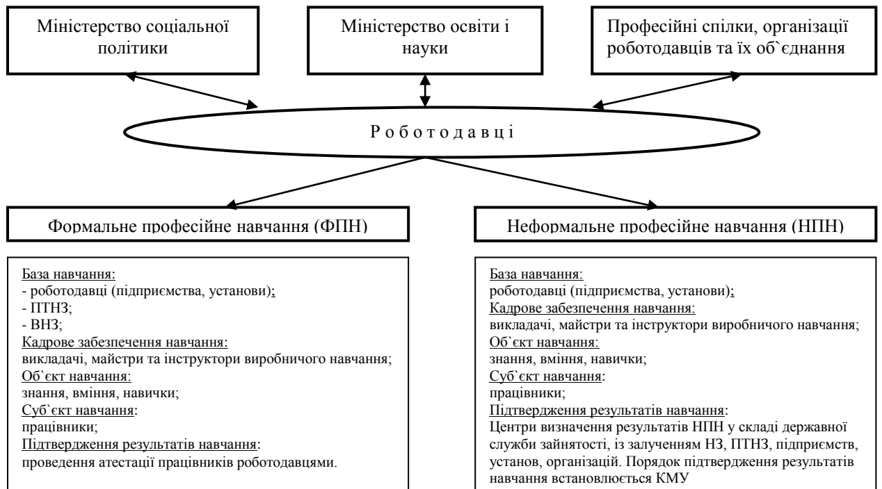
Рис. 2. Управління розвитком професійних працівників

Професійний розвиток працівників передбачає такі два основні підходи: