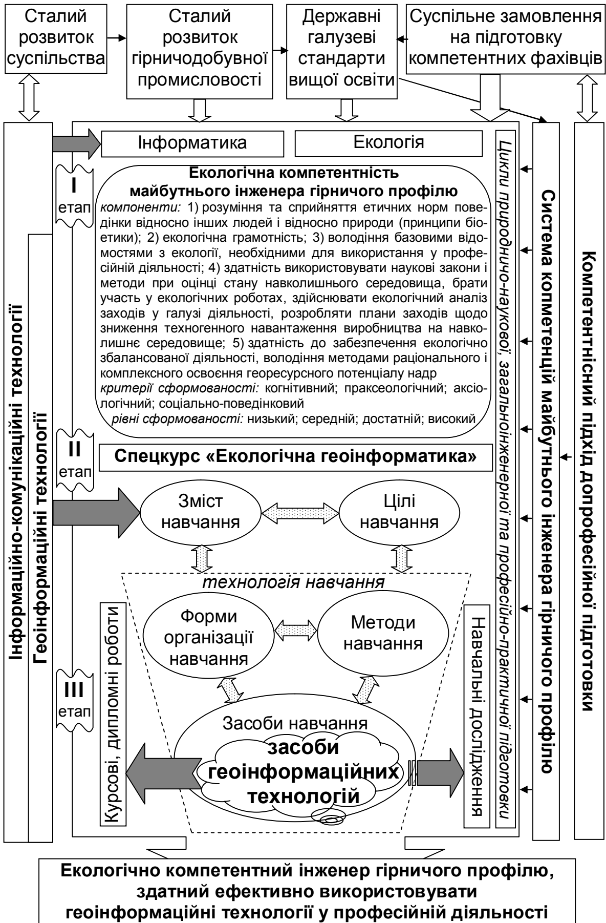
Рис. 1. Модель використання геоінформаційних технологій як засобу формування екологічної компетентності майбутніх інженерів гірничого профілю