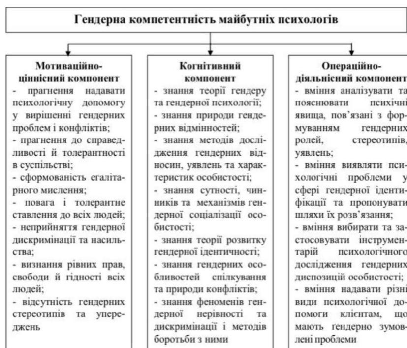
Рис. 1. Структура гендерної компетентності майбутніх психологів

ціннісний, когнітивний та операційно-діяльнісний компоненти (рис. 1)»[3, с. 4]. Науковці переконані, що для психолога найважливішою є “мотивація до надання психологічної допомоги на основі сформованих ціннісних уявлень про рівність всіх людей незалежно від їхніх гендерних ролей, неприпустимість дискримінації та насильства в будь-якій сфері людського життя”[3, с. 4]. Вони переконані, що “другим важливим компонентом є знання про психологічні механізми створення гендеру та його вияву в суспільній та приватній сферах”[3, с. 4]. Третій компонент включає “практичну здатність психолога організувати та надавати психологічну просвіту й допомогу (індивідуальну та групову) різним верствам населення з метою підвищення рівня гендерної культури й толерантності”[3, с. 5].