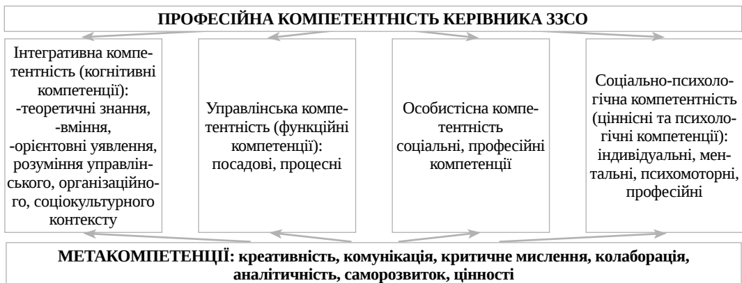
Рис. 2. Модель професійної компетентності креативного керівника в умовах державно-громадського управління на засадах партнерської взаємодії (Авторська розробка)

Принциповим є те, що реалізація цієї гіпотези та побудова моделі професійної компетентності креативного керівника в умовах державно-громадського управління на засадах партнерської взаємодії (Рис.2) надає «керівникові певні діяльнісні орієнтири відносно змісту і характеру здійснюваних функцій, у тому числі й стосовно вироблення та реалізації раціональних управлінських рішень у так званих проблемних чи нестандартних ситуаціях, особливо в умовах інформаційної невизначеності та ризику» (Кремень, 2008).