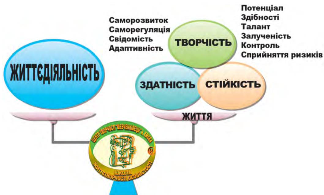
Рис. 1. Тріада формування особистості здобувача освіти «Життєтворчість – життєстійкість – життєздатність»

Проблема партнерської взаємодії, співпраці сім'ї й закладу освіти у вихованні дітей досить складна і багатоаспектна й стосується визначення світоглядно-філософських засад її втілення у практику, напрямів і контексту, структури взаємодії, розподілу обов'язків, ролей, завдань і функцій між усіма учасниками освітнього процесу, – вироблення спільних дій. Новий вектор освітніх можливостей, пов'язаний з Концептуальними засадами реформування Нової української школи, має спрямування на активне впровадження в освітній процес педагогіки партнерства як одного із основних факторів ефективної синергії його учасників. Аналіз практики свідчить, що виклики сьогодення стимулюють адміністрацію, здобувачів освіти й педагогічний колектив, батьківську громадськість, громадянські інституції, заклади позашкільної освіти й наукові установи до суспільно значущої результативної партнерської співпраці з метою створення безпечного розвивального середовища – «поля креативності», яке спонукає, мотивує, організовує та спрямовує їх до життєтворчості – життєстійкості в умовах війни й кризових ситуаціях – життєздатності до діяльності – до спільної мети – формування демократичних цінностей, усебічно розвиненої культурної особистості, виховання відповідальних громадян, патріотів, інноваторів, що здатні до свідомого суспільного вибору успішної самореалізації компетентностей й співпраці на користь іншим людям і країні (рис. 1).