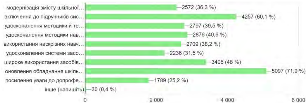
Рис. 1. Інструменти посилення прикладної спрямованості шкільної природничої освіти

змісту шляхом створення узгоджених модельних навчальних програм (36,3%), оптимізацію системи засобів навчання природничих предметів (31,5%) та активізацію допрофесійної підготовки учнів (25,2%) (рис. 1).