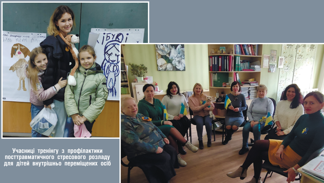
Учасниці тренінгу з профілактики посттравматичного стресового розладу для дітей внутрішньо переміщених осіб