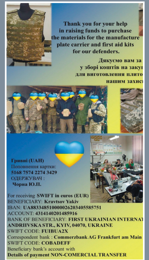
Волонтерство у ВСП «Львівський фаховий коледж індустрії моди Київського національного університету технологій та дизайну» – наближаємо Перемогу разом!