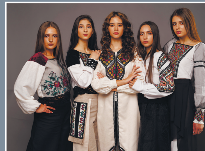
Колекція «Етнохата», фіналісти Всеукраїнського проєкту «Битва модельєрів»