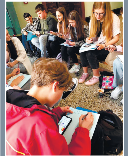
Під час інтеграційних занять для учнів підготовчих відділень Економічної школи імені Августа і Юлія Ветерів в Любліні з представниками ДЗВО «Університет менеджменту освіти» НАПН України (у змішаному форматі)