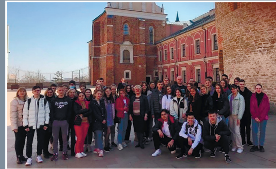
Під час екскурсії з українськими учнями, які навчаються в Економічній школі імені Августа і Юлія Ветерів в Любліні