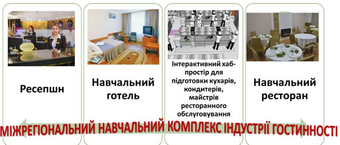
Рис. 1. Структура міжрегіонального навчального комплексу індустрії гостинності

Прикладом реалізації програми «EU4Skills: кращі навички для сучасної України» є створення у ДПТНЗ «Вінницьке вище професійне училище сфери послуг» міжрегіонального навчального комплексу індустрії гостинності (рис. 1).