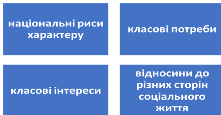
Рис.2.1. Окремі складові психічного образу особистості