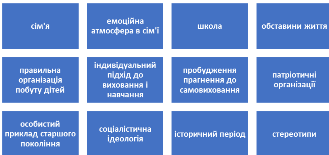
Рис.2.4. Умови формування характеру

На виховання характеру згідно української психологічної думки 50-х рр. XX ст. вирішальне значення мають такі умови: