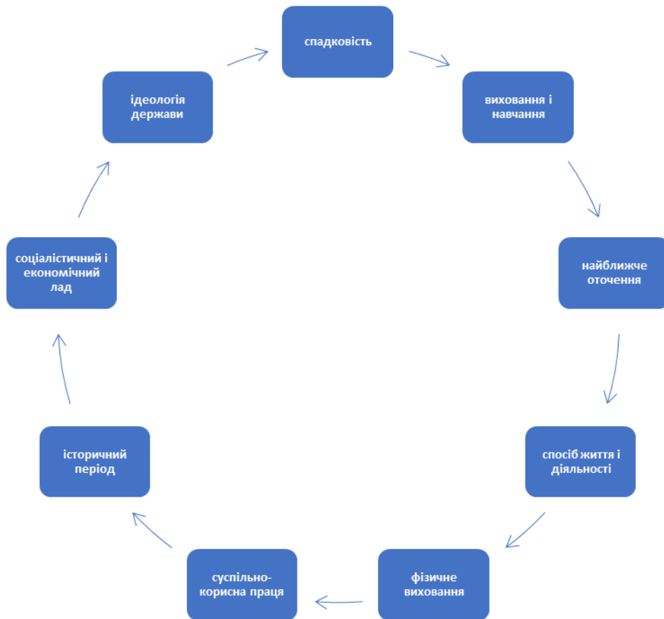
Рис. 2.5. Чинники психічного розвитку особистості

Українські психологи визнавали формування і розвиток особистості складним і тривалим процесом, у якому зовнішні впливи і внутрішні сили постійно взаємодіють, змінюють свою роль у залежності від стадії розвитку. Так, на першій стадії, що охоплює в основному дошкільний вік, розвиток особистості цілковито визначається ситуацією, найближчим оточенням. Зовнішні впливи і наслідування мають вирішальне значення у формуванні властивостей майбутньої особистості. По мірі накопичення знань і досвіду внутрішнє все більше і більше починає визначати характер поведінки дитини. Так уявлення про хороше і погане в поведінці починає регулювати власні вчинки у дитини старшого дошкільного віку. З розвитком і накопиченням знань у процесі навчання і виховання внутрішнє починає домінувати над зовнішнім в регуляції поведінки. Підліток керується визначеними принципами виходячи із намічених ним перспектив життя. У старшого школяра завершується процес перетворення знань у переконання, чіткіше вимальовується ідеал, поведінка стає принциповою.