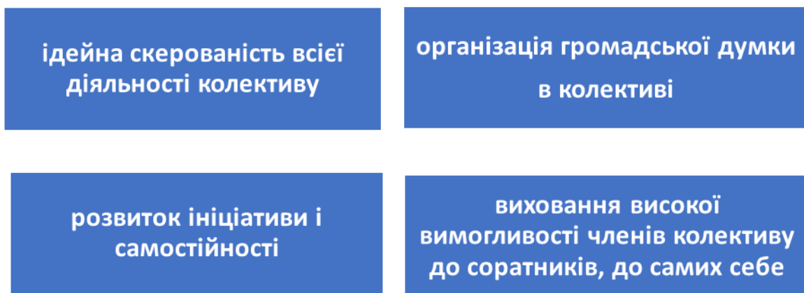
Рис.2.2. Умови позитивного впливу на розвиток самосвідомості

Позитивний вплив колективу на розвиток самосвідомості учнів, на формування їх ставлення до своєї навчальної і громадської діяльності здійснюють: