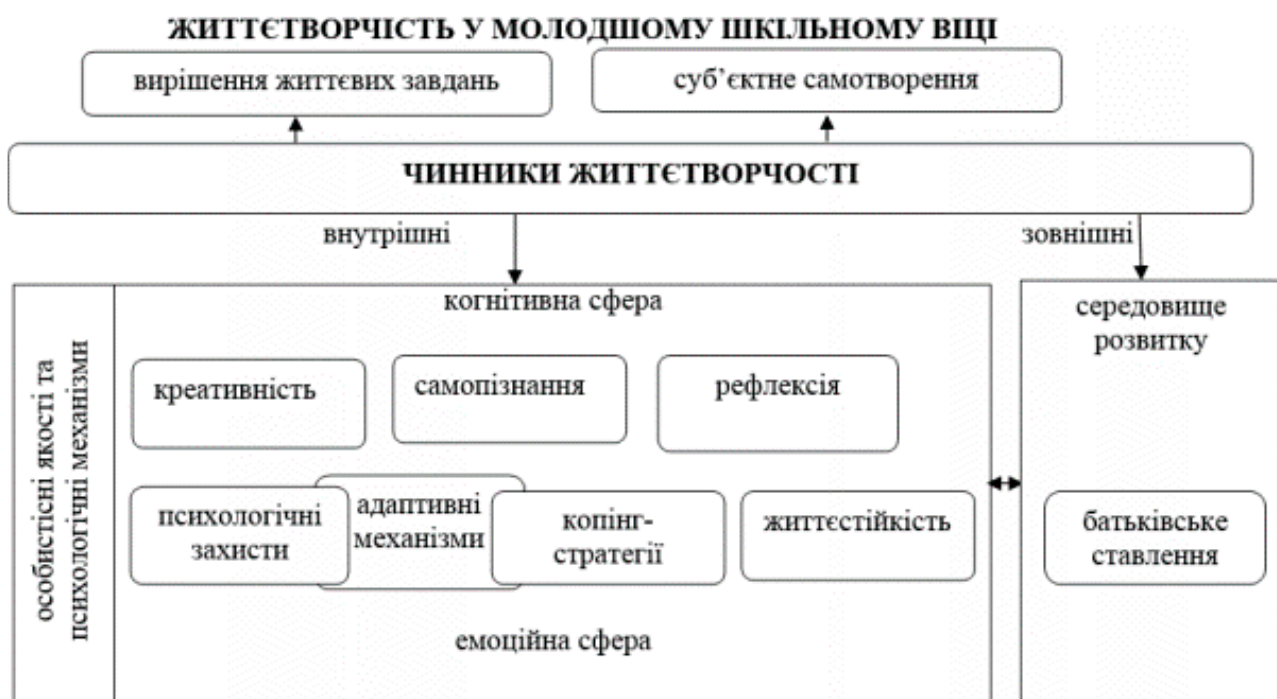
Рис. 3.4.1. Модель чинників життєтворчості у молодшому шкільному віці (запропоновано Т. Шелег (Шелег, 2019, с. 77))

Розвиваючи ідеї, подані зокрема в дослідженнях В. Ямницького, науковиця розглядає чотири групи чинників розвитку життєтворчості: адаптивні, креативні, рефлексивні і самопізнавальні. Також вона пропонує модель життєтворчості в молодшому шкільному віці (рис. 3.4.1).