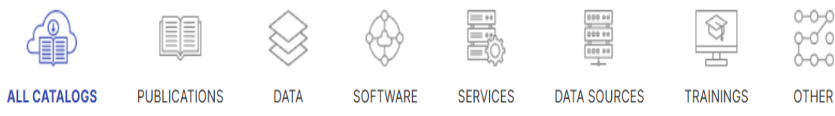
Рис. 1. Основна класифікація сервісів EOSC

Як один з найпоширеніших акаунтів пропонуємо обрати кнопку “Google”. При цьому не потрібно буде заповнювати додаткові поля чи вносити свої персональні дані. EOSC автоматично включить все що потрібно до нового профілю. Для цього достатньо погодитись на сторінці “Grant Access to EOSC Portal Home” з наданням доступу до даних акаунту Google натиснувши кнопку “Yes” (буде надано дозвіл на: перегляд основної інформації свого профілю та адреси електронної пошти). Після входу буде виконано перехід на головну сторінку. Для того, щоб розпочати роботу з порталом EOSC треба перейти до вкладки “Browse Marketplace” (під час переходу будуть з'являтися окремі сторінки із запитом на одержання доступу до додаткової інформації з акаунту Google, для коректної роботи, краще натиснути кнопку “Yes”). Основні категорії сторінки “Browse EOSC Marketplace Resources” показані на рисунку 1.