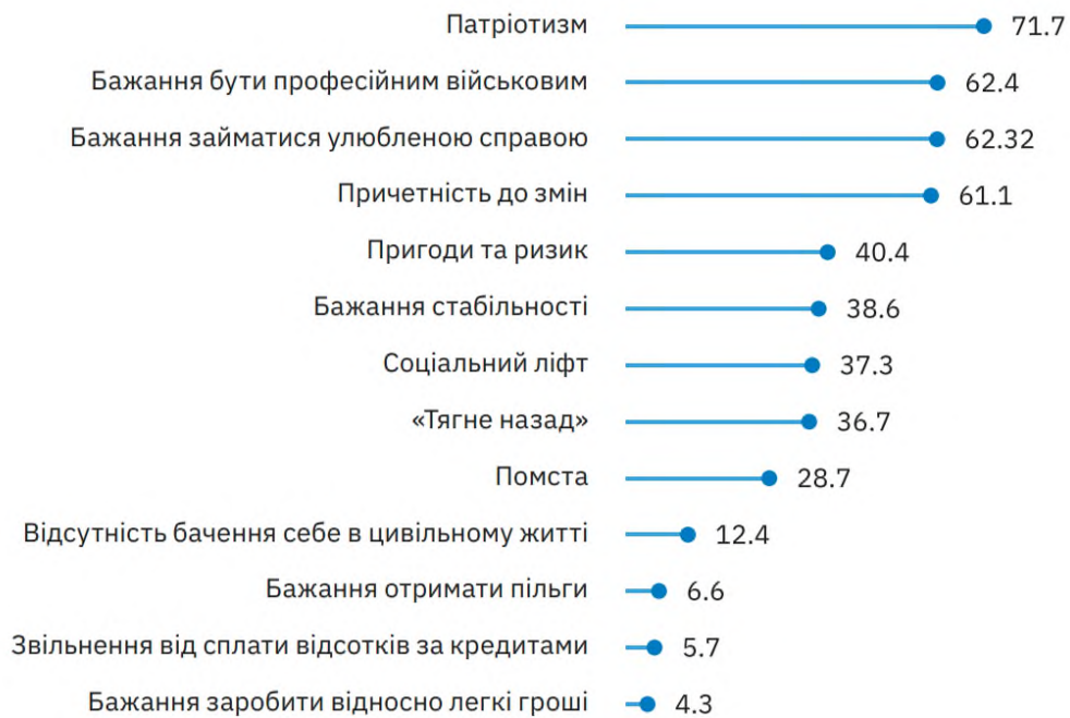
Рис. 3. Мотивація військовослужбовців (%)

В подальшому відслідковується тенденція зміни мотивації. Розглянемо квінтесенцію методики відслідковування тенденції зміни мотивації майбутнього офіцера.