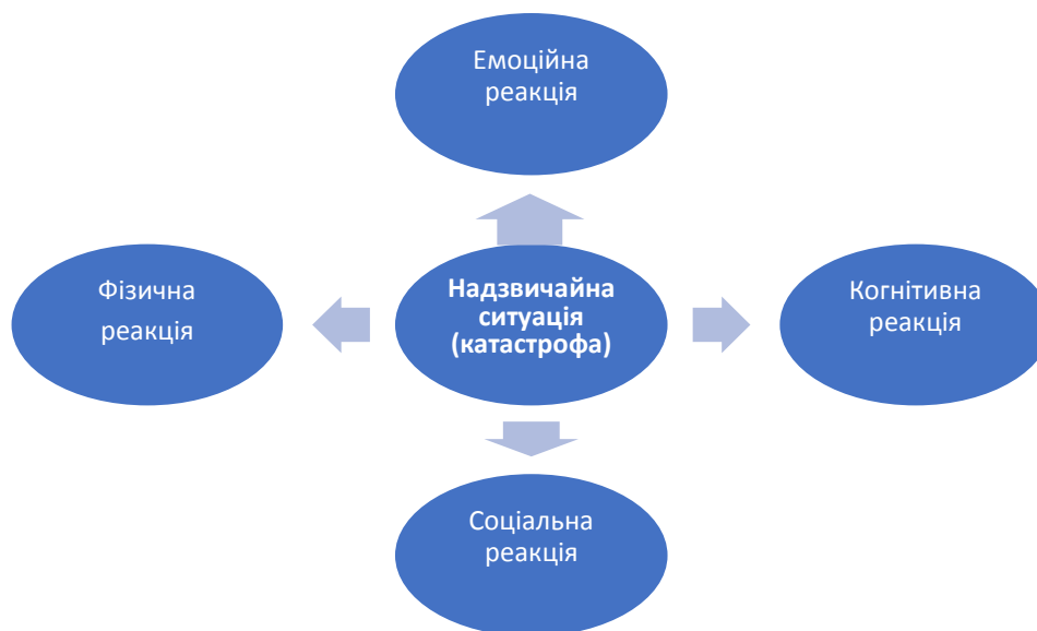
Рис. 3. Реагування постраждалих на надзвичайну ситуацію

Одним із завдань психологів ДСНС у надзвичайній ситуації є надання постраждалим першої психологічної допомоги . Її ефективність, зокрема, буде залежати від здатності фахівців швидко оцінити та врахувати у своїй роботі характер реагування постраждалих на надзвичайну ситуацію (рис. 3).