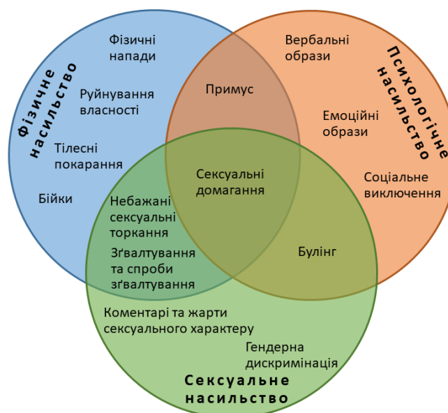
Рис. 2. Типологія булінгу та насильства (Балакірева, 2018)

Людину, яку вибрали жертвою і яка не може постояти за себе, намагаються принизити, залякати, ізолювати від інших різними способами. Насильство це не лише завдання фізичної шкоди, розрізняють фізичне, психологічне та сексуальне насильство (рис. 2).