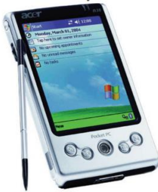
Рис.7. Кишеньковий персональний комп'ютер

192. Педагогічний програмний засіб. Цілісна дидактична система, заснована на використанні комп'ютерних технологій і засобів Інтернету, яка ставить за мету забезпечити навчання за індивідуальними і оптимальними навчальними програмами з керуванням процесу навчання. (Що таке «педагогічний програмний засіб» [Електронний ресурс] // Електронні засоби навчання : [Сайт]. – Режим доступу: http://www.znanius.com/3875.html . – Дата звернення: 12.06.2016. – Назва з екрану).