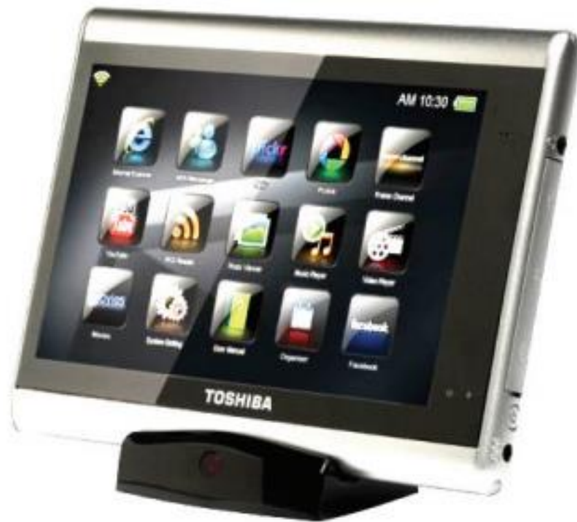
Рис.9. Планшетний комп'ютер

196. Подкастинг (від англ. podcasting — похідне від слів iPod, популярний mp3-плеєр від Apple та broadcasting, масове мовлення). 1) новий формат поширення аудіо контенту через Інтернет. З технічної точки зору, подкастинг не є революційним – це введення мультимедіа контенту в rss-канал. Проте, з точки зору своїх можливостей, подкастинг є синтезом переваг Інтернет та радіо. Американський дослідник Barnes Lisa вбачає в подкастингу значні перспективи. Поширення подкастингу буде настільки ж важливим для комунікації, яким колись було поширення друкарських верстатів. Це прекрасна ілюстрація того, як мобільні медіа та автоматизація процедури доступу до медіа змінює правила гри в медіа сфері. Подкастинг – це не стільки технологія як потужний зсув фокусу влади медіа. Більше не треба бути «великим», для того щоб вести мовлення. Немає потреби в прив'язці до громіздкого обладнання (антен, кабелів, комп'ютерів та ін) для отримання контенту. Отримання прибутку більше не вимагає аудиторій в сотні тисяч. Для такого мовлення не потрібна ліцензія. А виробництво власне програмного продукту більше не підкоряється традиційним форматам.