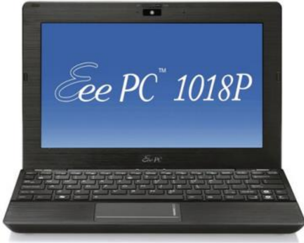
Рис. 12. Субноутбук

– Дата звернення: 30. 05. 2016. – Назва з екрану).