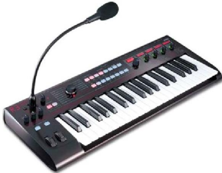
Рис. 3. Вокодер

вокодер, реалізований у вигляді VST-плагінів (VST-pugins), так як вони більш гнучкі в налаштуванні. Застосовуються подібні рішення вокодерів не самі по собі, а разом з програмою-хостом. Нею може бути будь-яка віртуальна студія, що підтримує технологію VST, наприклад: Cakewalk SONAR, Steinberg Cubase або Fruity Loops Studio. Програма хост уможлиблює підключення власне самого вокодера, і вибирати модулюючий сигнал (деякі вокодери мають вбудований синтезатор несучого сигналу) - з синтезаторів і семплерів, або с мікрофонів та інших підключених до звукової мапи інструментів. А управління несучим сигналом здійснюється за допомогою MIDI команд, що надходять з MIDI-секвенсора або MIDI-клавіатури в VST-плагін (синтезатор або семплер) Прикладом віртуальних вокодерів можуть служити VST- плагіни, такі, як: Steinberg Vocoder, Fruity Vocoder, Akai DC Vocoder, Voctopus, AC vocoder, Formulator, Lpc-vocoder, Darkoder, Cylonix (рис. 3). ( Vocored [Електронний ресурс] / Techtarget. – Режим доступу: http://whatis.techtarget.com/definition/vocoder . – Дата звернення: 22.07.2016. – Назва з екрану ).