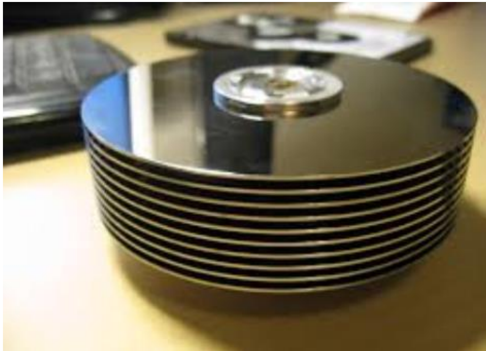
Рис.4. Накопичувач на жорстких магнітних дисках

запис даних здійснюється на жорсткі пластини, виготовлені з легкометалевого сплаву або скла, вкриті шаром спеціального магнітного матеріалу (найчастіше - двоокисом хрому). Залежно від конструкції, в HDD можуть використовуватися одна або кілька таких пластин, що швидко обертаються на одній осі. За рахунок обертання створюється своєрідна повітряна подушка, завдяки якій зчитувальні головки не торкаються поверхні пластин, хоча й знаходяться дуже близько від них (всього кілька нанометрів). Це гарантує надійність запису та зчитування даних. При зупинці пластин головки переміщуються за межі їх поверхні, тому механічний контакт між головками та пластинами практично виключений. Така конструкція забезпечує довговічність запам'ятовуючих пристроїв цього типу. Крім пластин, до складу HDD входить накопичувач, привод і блок електроніки. Завдяки високій надійності роботи і відносно невисокій вартості, жорсткі диски є найпоширенішим пристроєм зберігання інформації. Існує багато типів твердих дисків, але всі вони складаються з одних і тих же вузлів із спільним принципом роботи. (рис. 4). ( Жорсткий диск [Електронний ресурс]. – Режим доступу: http://glossary.starbasic.net/index.php?title=Жорсткий_диск . – Назва з екрану ).