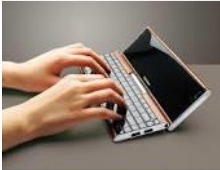
Рис. 1. WALLET PC

http://whatis.techtarget.com/definition/wallet . – Дата звернення: 18.05.2016. – Назва з екрану).