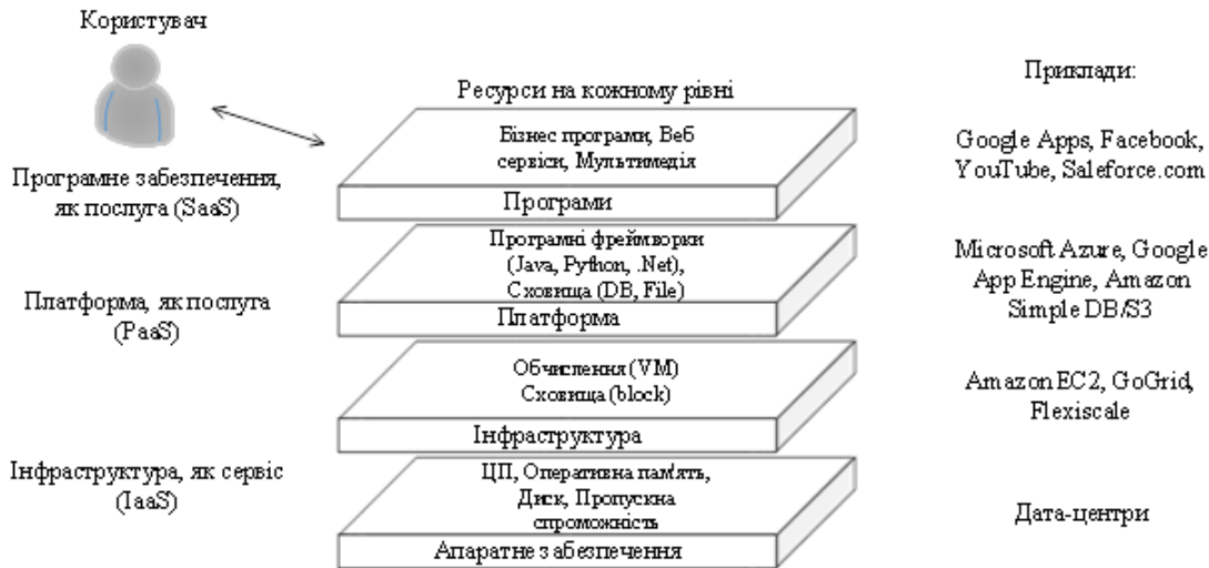
Рис. 11. Багаторівнева модель хмарних обчислень

1) рівень апаратних засобів дата-центр; 2) рівень інфраструктури; 3) рівень платформи; 4) прикладний рівень (Рис. 11) (Qi Zhang. Cloud computing: state-of-the-art and research challenges / Zhang Q., Cheng L., Boutaba R.: J Internet Serv Appl (2010).