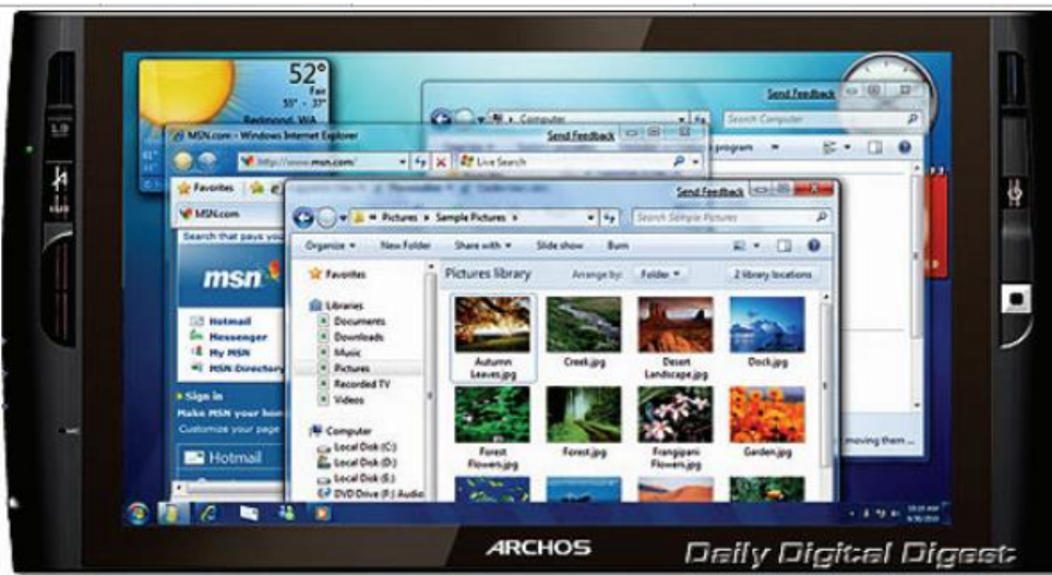
Рис.8. Планшетний комп'ютер

фотографій, сайтів та презентацій тощо (рис. 8). (Петрович С. Д. Основи роботи за комп'ютером [Текст] / С. Д. Петрович // Комп'ютер у школі та сім'ї, 2013. № 2. – С. 10 – 12).