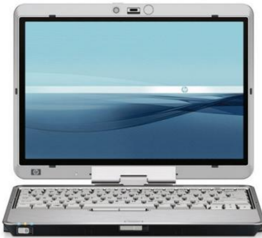
Рис. 6. Ноутбук

184. Ноутбук (розм.). 1) Портативний комп'ютер, що звичайно важить близько 7 фунтів (~3,18 кг) і має розміри близько 20x27x4 см. Зроблений таким, щоб поміститися в портфель. Комп'ютери notebook, на відміну від субноутбука (sub notebook) і персонального цифрового секретаря (PDA), мають дисковод для дискет, жорсткий диск, пристрій для використання дисків CD-ROM і DVD. Останнім часом характеристики ноутбуків значно покращуються. ( Глумачний словник з інформатики / Г. Г. Півняк [та ін.]. – Д., Нац. гірнич. ун-т, 2010. – 600 с. [С. 445] ); 2) портативний комп'ютер, у корпусі якого об'єднані типові компоненти персонального комп'ютера, включаючи дисплей, клавіатуру, модем, привід CD-ROM і вказівний пристрій (сенсорна панель або тачпад), а також акумуляторні батареї. За своїми розмірами близький до книги великого формату (рис. 6). ( Петровиц С. Д. Основи роботи за комп'ютером [Текст] / С. Д. Петровиц // Комп'ютер у школі та сім'ї, 2013. № 2. – С. 10 – 12 ).