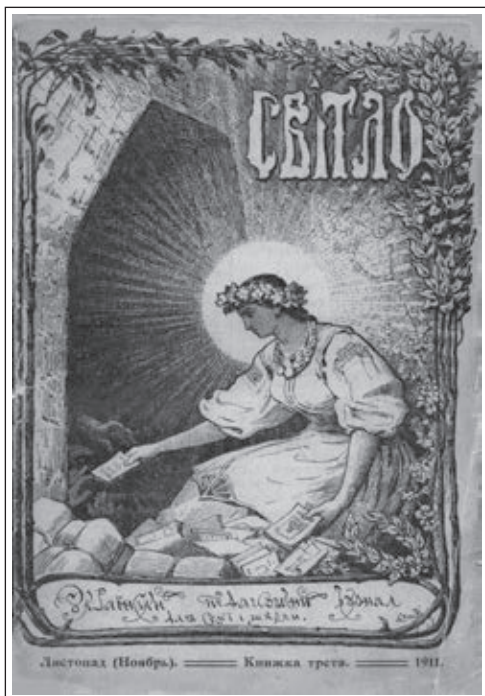
Prva ukrajinska pedagoška revija »Svitlo« (november 1911) / Перший український педагогічний журнал «Світло» (1911, Листопад) / The first Ukrainian pedagogical magazine «Svitlo» (November 1911).