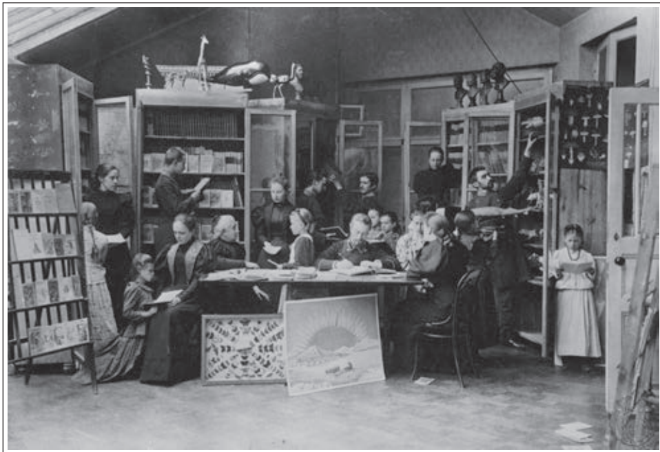
Pouk v dekliški nedeljski šoli Hristine Alčevske. Harkov, po 1890.

Заняття у жіночій недільній школі Христини Алчевської. Харків. 1890-ті рр. The classes in the all-girls Sunday school of Khrystyna Alchevska. Kharkiv. 1890s.