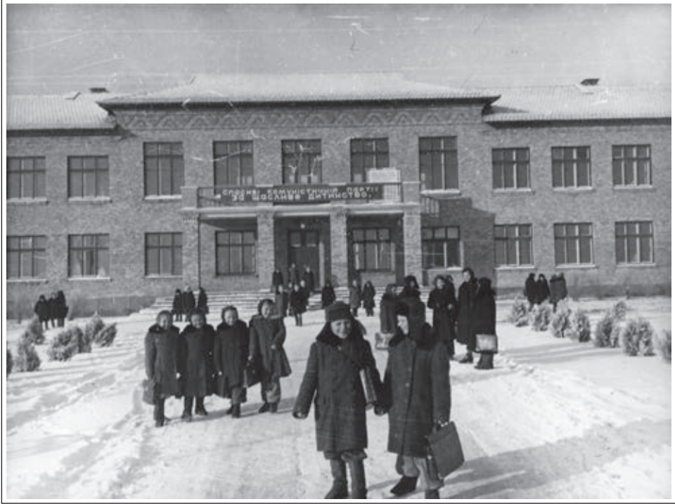
Тіпична подеžельська школа в селі Ксаверівка в регіоні Київ, збудована 1959. Фотograфiровано в згодних 60. лeтiх 20. стол. / Тунова сільська школа у с. Ксаверівка Київської області. Збудована у 1959 р. Фото поч. 1960-х рр. / A typical village school in Ksaverivka village in Kyiv Region. It was built in 1959. The photo was taken in early 1960s.

Шкільні будівлі. Протягом 1910-1916 рр. в період розвитку громадської ініціативи, в центральному регіоні України - у селах на Полтавщині було побудовано близько 100 шкіл у стилі український архітектурний модерн (архітектор Опанас Сластiон; 1855-1933) на кошти земств – органів місцевого самоврядування. Особливістю їх є шестигранні вікна та застосування розкладних дерев'яних перегородок, які дозволяли об'єднувати класи між собою в одну велику залу. Завдяки башточкам, увінчаним шпилями, школа набувала значення світського освітнього центру села на противагу церкві – традиційному релігійному центру. До сьогодні збереглося близько 50 шкіл, деякі досі функціонують.