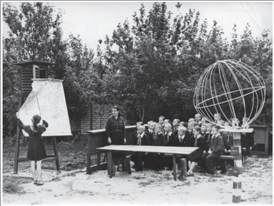
Pouk geografije na igrišču srednje šole v Harkovu, fotografirano 1959. / Урок на географічному майданчику середньої школи у Харкові. Фото 1959 р. / A lesson on a geographical field of a secondary school in Kharkiv. The photo was taken in 1959.

Шкільні підручники і педагогічна література. «Буквар» видатного українського поета Тараса Шевченка (1814-1861) виданий 1861 року тиражем 10 000 для початкового навчання грамоти дітей та дорослих українців рідною мовою в недільних школах. Складений із кращих зразків українського фольклору та частково з власних творів.