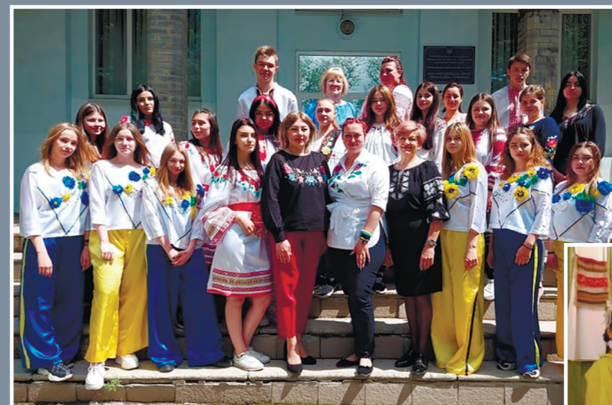
День вишиванки у ДНЗ «Костянтинівське ВПУ» Донецької області