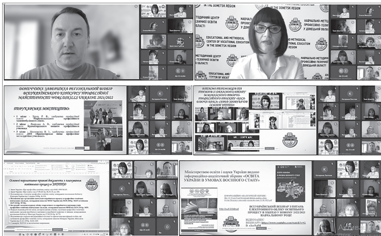
Онлайн-засідання обласної методичної секції педагогічних працівників ЗП(П)ТЮ за напрямом підготовки сфери послуг

До надважливих інноваційних питань органі- зації роботи закладів професійної освіти в цьому році можна віднести напрям електронного облі- ку освітнього процесу. Деякі педагогічні колекти- ви профтехосвітан України вже мають такий до- свід, що був напрацьований протягом всесвітньої пандемії у 2020–2021 рр. Тому організаційним