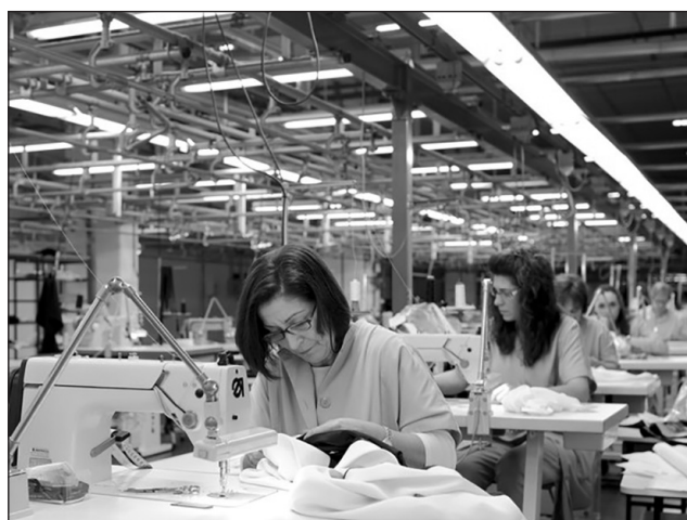
Сучасне швейне виробництво

Цей нормативно-правовий документ дає змогу пришвидшити шлях до робочого місця для людей, які втратили роботу, швидко опанувати елементи нової професії та працевлаштуватися. Ці зміни є дуже актуальними для українців під час війни: концепція про освіту впродовж життя, несподівано перетворилася на тенденцію – «отримання нових кваліфікацій для виживання».