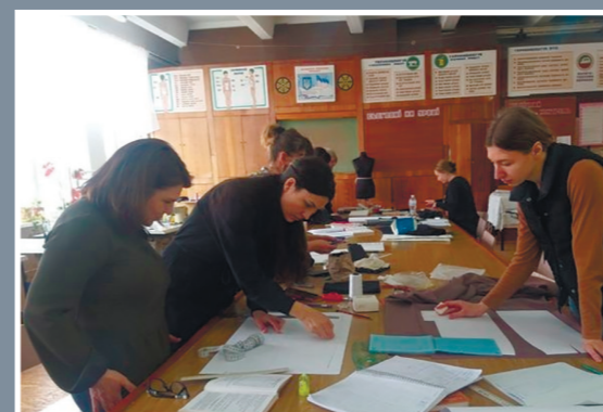
Переселенки з Донеччини опановують швейну спеціалізацію в Хмельницькому професійному ліцеї