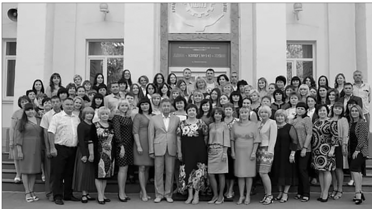
Колектив Краматорського ВПУ

крема Google Classroom та проводять онлайн-уроки, консультації за допомогою програми Google Meet.