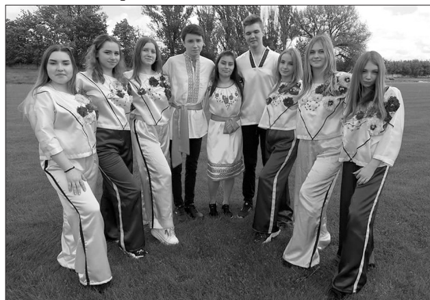
Національно-патріотичний челлендж у ДНЗ «Костянтинівське ВПУ»

Значна увага приділяється відзначенню міжнародних і державних свят, пам'ятних дат та скорботних днів, зокрема: Дня Героїв Небесної Сотні, Міжнародного дня рідної мови, Дня пам'яті та примирення, Дня перемоги над нацизмом у Другій світовій війні, Дня Конституції України, Дня Незалежності України, Дня Державного Прапора України та багато інших. Педагоги обирають різні форми проведення заходів: диспути, семінари, круглі столи, флешмоби, челленджі, вікторини тощо.