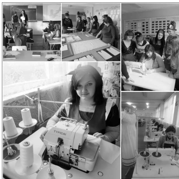
Майбутні повелительки голки та нитки здобувачі освіти професійно-технічного училища № 54 смт Котельва Полтавської області

Практика запровадження інтегрованих професій спостерігається і в країнах Європейського Союзу, а про активність роботодавців у їх розробленні свідчить статистика: у Бельгії, Фінляндії, Франції, Німеччині, Італії, Естонії, Латвії понад 30 % освітніх програм створено у співпраці з роботодавцями, значна частина цих освітніх програм реалізується на базі підприємств [2].