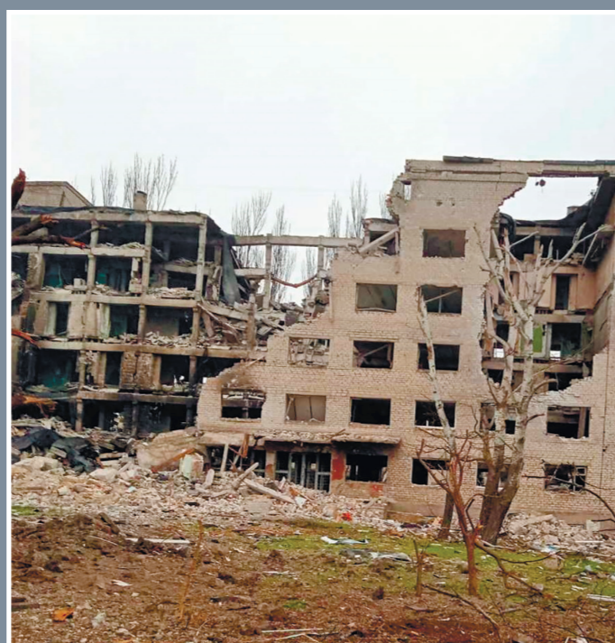
Маріупольський професійний ліцей автотранспорту. Навчальний корпус. Весна 2022 р.