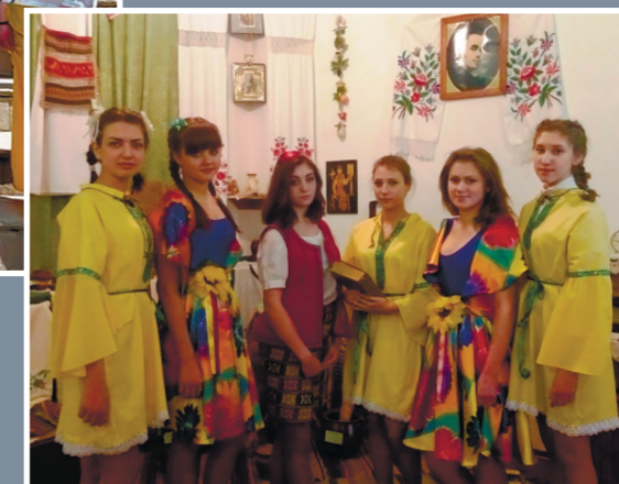
Шевченківські свята у музейній кімнаті ДНЗ «Краматорське вище професійне торгово-кулінарне училище» Донецької області