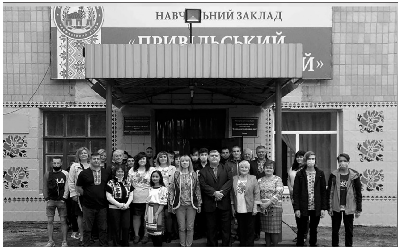
Колектив ДПТНЗ «Привільський професійний ліцей»

Із 24 лютого 2022 року бойові дії у Луганській області змінили все. Артилерійські обстріли, ракетні та авіаудари, знищується інфраструкту-