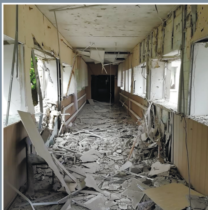
Великоновосілівський профільний ліцей. Сільськогосподарський профіль. Перехід між корпусами. Літо 2022 р.