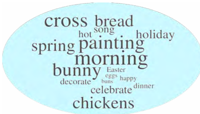
Рис. 2. Хмара тегів на складання словосполучень

Прикладом хмари тегів може бути, наприклад, завдання: складіть словосполучення з поданих слів (рис. 2).