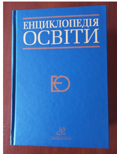
Видання «Енциклопедія освіти»