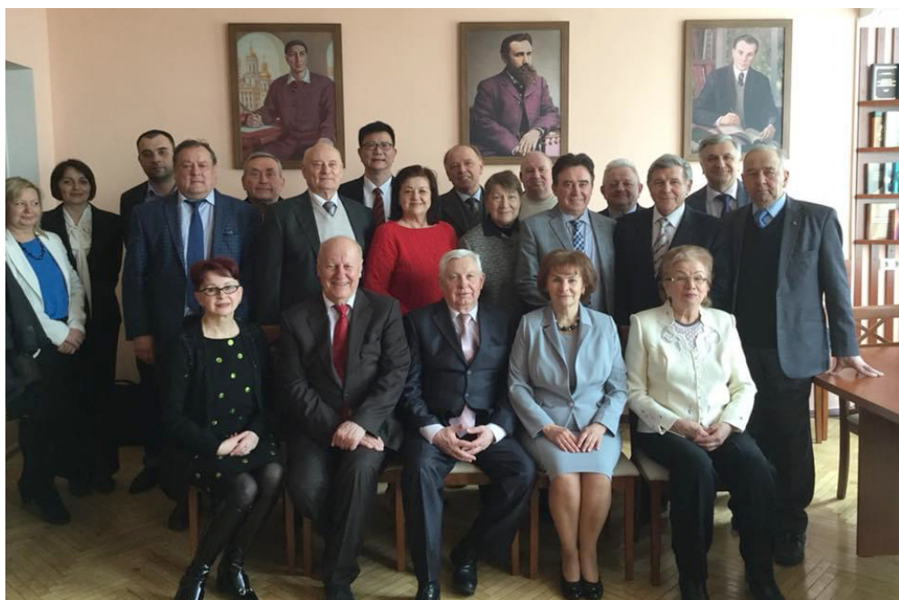
Відділення філософії освіти, загальної та дошкільної педагогіки НАПН України, 2019 р.

Нині членами Відділення є 12 дійсних членів (академіків), 18 членів-кореспондентів, 3 іноземні члени, 3 почесні доктори та почесний академік НАПН України. До відання Відділення віднесено: Інститут проблем виховання НАПН України, чотири відділи Інституту педагогіки НАПН України (історії та філософії освіти, порівняльної педагогіки, інновацій та стратегій розвитку освіти, економіки та управління загальною середньою освітою), Державна науково-педагогічна бібліотека України імені В.О. Сухомлинського, а також установи, що діють на засадах самофінансування, — Науково-дослідний центр проблем соціальної педагогіки і соціальної роботи (спільно з Луганським національним університетом імені Тараса Шевченка), Науково-дослідний центр з проблем гендерної освіти і виховання учнівської та студентської молоді (спільно з Тернопільським національним педагогічним університетом імені Володимира Гнатюка) та Науково-дослідний центр педагогічного краєзнавства (спільно з Уманським державним педагогічним університетом імені Павла Тичини).