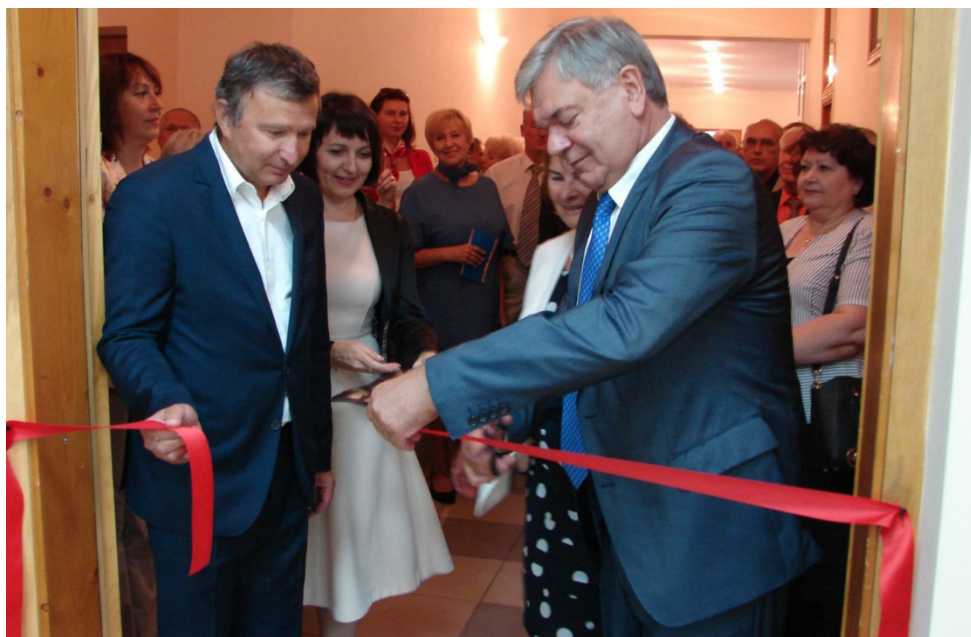
Відкриття Науково-інформаційного центру НАПН України, 2018 р.

6 вересня 2018 р. в день 90-річчя від дня народження Миколи Дмитровича Ярмаченка — першого президента НАПН України, дійсн. чл. (акад.), докт. пед. наук, проф., колишнього багаторічного директора Інституту педагогіки, відомого вченого й вихователя плеяди українських науковців-педагогів — відбулося відкриття Науково-інформаційного центру НАПН України.