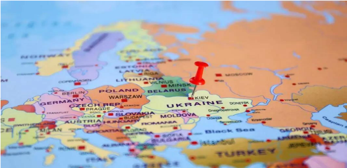
Рис. 1. Вплив війни в Україні на міграційну ситуацію в ЄС [] (за URL: карт війн у світі – Google Поиск )

Це понад 1 відсоток населення планети. Якщо прирівнювати до країн за кількістю населення, то така цифра еквівалентна країні, яка займає 14-те місце за їх чисельністю у світі. Сюди входять біженці та шукачі притулку, а також 53,2 мільйона людей, переміщених усередині своїх кордонів внаслідок конфлікту, згідно даних Центру моніторингу внутрішнього переміщення (IDMC) [1].