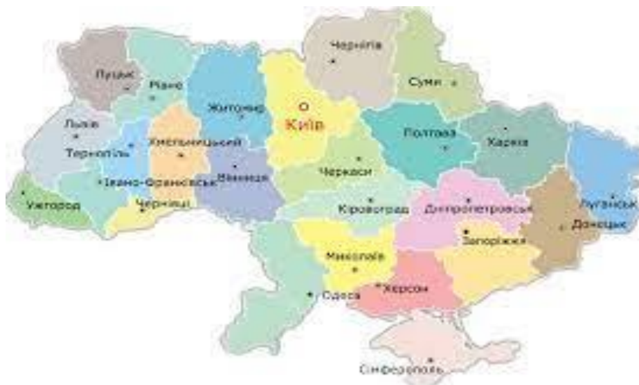
Рис. 3. Області на мапі України [4]

На тепер 1972 заклади освіти постраждали від бомбардувань та обстрілів. 194 з них зруйновано повністю. Розглянемо і проаналізуємо руйнівні наслідки війни в Україні в розрізі областей, що представлені на рисунку 3.