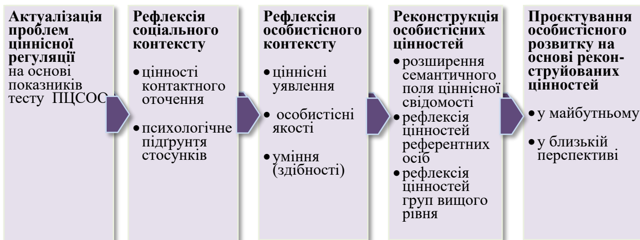
Рис. 2. Етапи рефлексійної бесіди як методу надання ціннісної підтримки

Перший етап рефлексійної бесіди – актуалізація проблеми ціннісної регуляції – спрямований на загальний аналіз показників тесту, виокремлення субшкал, за якими отримано високі та низькі показники. Психолог вибудовує свої репліки і питання в такий спосіб, щоб ініціатива у висловлюваннях була переважно в досліджуваного. На завершення цього етапу необхідно зробити короткий підсумок в якому резюмувати з використанням висловлювань досліджуваного основні моменти його ціннісного профілю. На них має бути сфокусовано весь подальший перебіг бесіди.