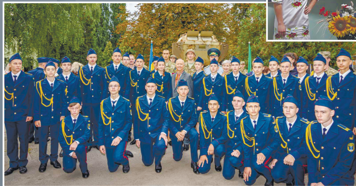
Курсанти ДНЗ «Київський професійний коледж з посиленою військовою та фізичною підготовкою»