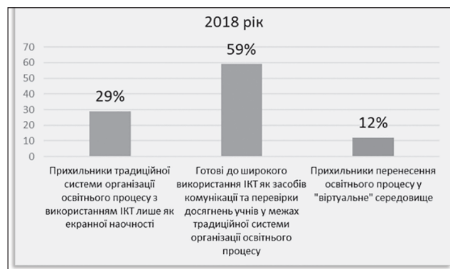
Рис. 1. Розподіл викладачів за способом використання ІКТ у освітньому процесі (2018 р.)

З початку XXI ст. активно здійснювалась підготовка майбутніх педагогів до широкого використання можливостей комп'ютерної техніки та глобальної мережі у межах освітнього процесу, але, зазвичай, все це розглядається як технічні засоби навчання у межах традиційної освіти. Наприкінці 20-х років нашого століття стало зрозуміло, що у найближчі часи відбуватимуться суттєві зміни в освіті (рис. 1).