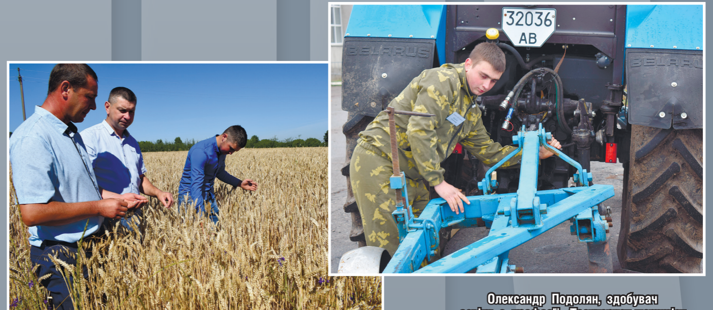
На полях навчального господарства Вищого професійного училища № 41 м. Тульчина