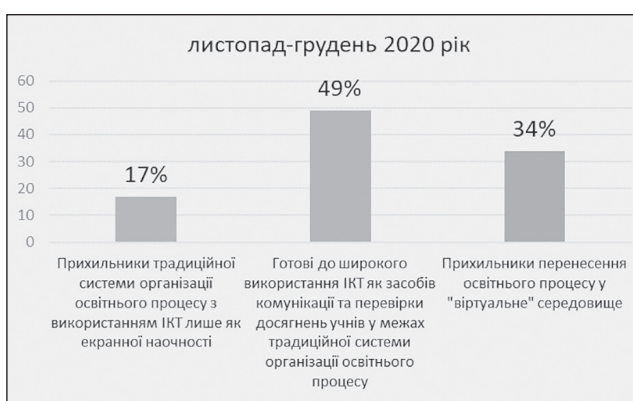
Рис. 2. Розподіл викладачів за способом використання ІКТ у освітньому процесі (кінець 2020 р.)

Передумовою такої ситуації стала трансформація соціальних взаємодій молоді з урахуванням наявних цифрових технологій. Вона зорієнтована на миттєве отримання необхідної інформації у контексті проблеми, що розв'язується; інформація має бути викладена у компактній, лаконічній формі, бажано у вигляді інфографіки; перевага віддається відео- або аудіо потокам замість текстів [3]. Перехід на нові правила проведення навчальних занять спричинили карантинні заходи. Пріоритетним стало питання про організацію освітнього процесу на основі цифрових технологій (рис. 2). Як і раніше, для більшості педагогів це стало шоковою терапією.