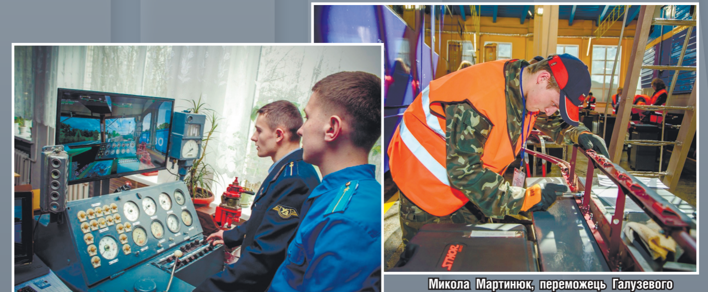
Відпрацювання здобувачем освіти дій помічника машиніста електровоза на шляху прямування за допомогою тренажера з управління локомотивом та усунення несправностей «ZD Simulator»