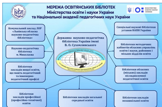
Мережа освітянських бібліотек МОН України та НАПН України

Установа плідно співпрацює з науковими установами, закладами освіти, Київською малою академією наук, бібліотеками, Педагогічним музеєм України, громадськими організаціями (Всеукраїнською асоціацією Василя Сухомлинського, Українською бібліотечною асоціацією) тощо. На її базі