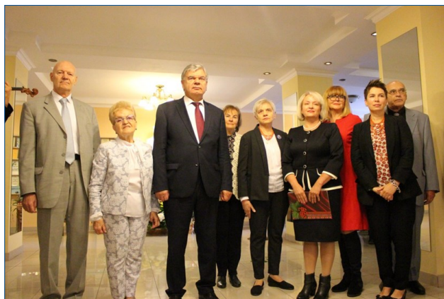
Урочисте відкриття музейної експозиції, 2018 р.

До здобутків відносимо й відкриття з нагоди 20-річчя від дня заснування ДНПБ музейної експозиції «ДНПБ України ім. В.О. Сухомлинського НАПН України: історія і сучасність», що є основою для проведення екскурсій у бібліотеці та сприяє популяризації не лише її роботи, а й діяльності НАПН України (Березівська, 2019а).