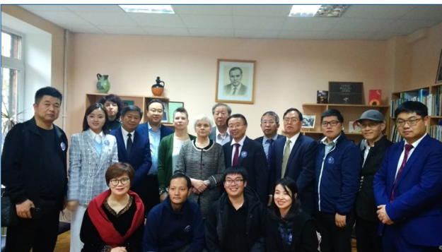
Китайські освітяни в читальному залі Фонду В.О. Сухомлинського, 2019 р.

Здійснено формування інформаційних ресурсів, зокрема електронних: поповнено базу даних «Сухомлиністика» електронного каталогу ДНПБ, колекцію «Сухомлиністика» Науково-педагогічної електронної бібліотеки, запроваджено онлайн-проекти. Читальний зал відвідують освітяни, науковці з різних куточків України та зарубіжжя: делегації з Республіки Польща й Китайської Народної Республіки. Із 2021 р. діє віртуальний читальний зал Фонду В.О. Сухомлинського з метою цілісного представлення розвитку сухомлиністики в освітньо-науковому просторі України та світу (Березівська, 2021а).