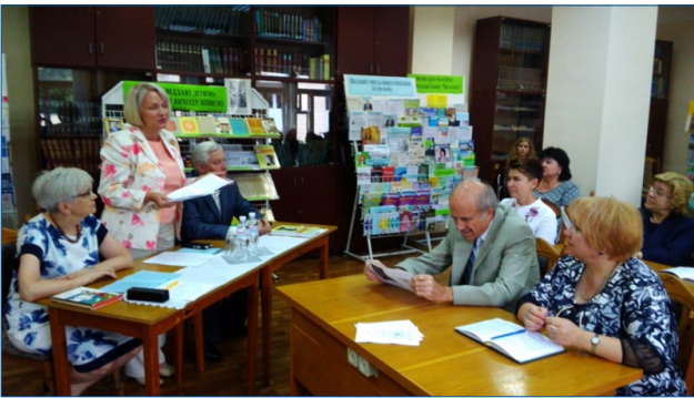
Круглий стіл «Серце віддаю дітям», 2018 р.

Здійснено формування інформаційних ресурсів, зокрема електронних: поповнено базу даних «Сухомлиністика» електронного каталогу ДНПБ, колекцію «Сухомлиністика» Науково-педагогічної електронної бібліотеки, запроваджено онлайн-проекти. Читальний зал відвідують освітяни, науковці з різних куточків України та зарубіжжя: делегації з Республіки Польща й Китайської Народної Республіки. Із 2021 р. діє віртуальний читальний зал Фонду В.О. Сухомлинського з метою цілісного представлення розвитку сухомлиністики в освітньо-науковому просторі України та світу (Березівська, 2021а).