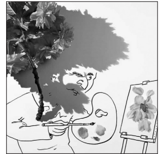
Фото 3–6. Вінсент Баль. Оригінальні художні образи

жується, і мотивувати учнів на виконання практичного завдання, яке потребує не лише значного зосередження, а й емоційного переживання, стає складно. Потрібно, вихід передач у прямому ефірі має бути регулярним, через визначений та заздалегідь обумовлений проміжок часу. Особливо слід зазначити залежність ефективності занять від якості Інтернету під час прямого ефіру. При цьому наголосимо: запис заняття дає можливість передивлятися його багато разів і звертатися до будь-якого фрагменту, зокрема й покрокового супроводу виконання художньо-творчого завдання.