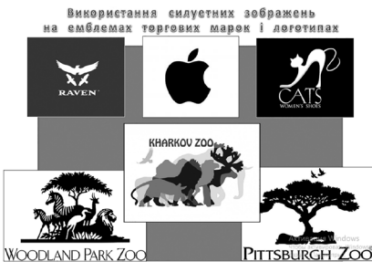
Фото 2. Використання силуетних зображень на емблемах торговельних марок і логотипах

Завершальним «майданчиком» подорожі шляхами силуетних зображень є «сторінка» практичної роботи. Після переліку необхідних для роботи художніх матеріалів пропонується перегляд короткого відео і пояснення послідовності виконання творчого завдання «Уяви та домалуй образ»: