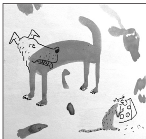
Фото 7–9. Ілюстрація з книги художників Пенга, Ху. «Хірамеки»