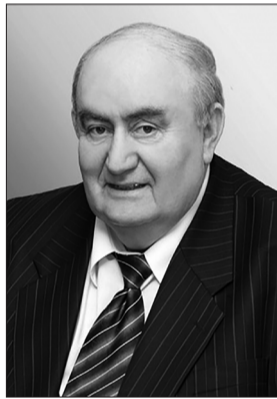
Роман ГУРЕВИЧ, академік НАПН України

Світові та євроінтеграційні процеси, нові виклики, суперечності та загрози в умовах переходу до цифрової економіки і суспільства зумовлюють необхідність якісних змін в організації освіти дорослих як невід'ємної складової освіти впродовж життя. За результатами міжнародних досліджень у країнах-членах ОЕСР у середньому 40% дорослих беруть участь у програмах освіти для дорослих, тоді як у нашій країні лише 9% дорослих охоплено нині різними видами навчання.