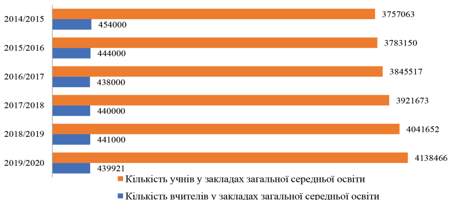
Рис. 1. Динаміка кількості вчителів і учнів у закладах загальної середньої освіти (2014/2015–2019/2020 н.р.)

Водночас у цей же період кількість здобувачів загальної середньої освіти зростала і у 2019/2020 н.р. становила 4 138 466 особи (рисунок 1).