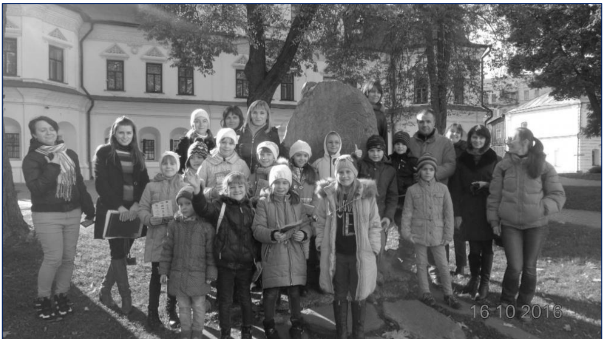
Рис. 2. Біля меморіального знаку на честь першої бібліотеки заснованої Ярославом Мудрим у Софіївському соборі.

КРОК 2. Стратегія як спосіб досягнення важливої мети. Наступний (другий) крок ми робимо власне в науку, точніше застосовуємо методи дослідження: використовуємо досвід, висуваємо гіпотезу, робимо висновки та перевіряємо їх. На перший погляд все просто, але це на перший погляд. Як молода людина може використати досвід вивчаючи карту (рис. 1)? Найперше, це те, що ви там вже побували, тобто відвідали. Наприклад, здобувачі освіти СШ № 200 м. Києва, які беруть участь у діяльності творчого об'єднання «Юні кияни» 2016 р. відвідали Софіївський собор і Києво-Печерську лавру в Києві (рис. 2).