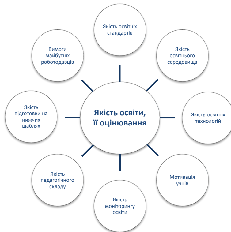
Рис. 1. Діаграма оцінки якості освітньої діяльності

Оцінка якості освітньої діяльності включає в себе наступні елементи (рис. 1):