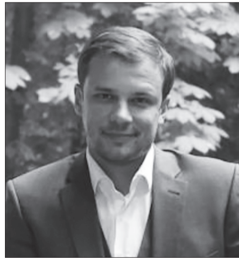
Сергій Віталійович Бабах

За словами Прем'єр-міністра України Олексія Гончарука, уряд зосередиться на освіті як на одному з основних пріоритетів. І реалізувати це твердження має Комітет з питань освіти, науки та інновацій Верховної Ради України, який очолює Сергій Віталійович Бабах . Голова комітету 1978 р.н. є доктором технічних наук, кандидатом економічних наук. Економічну освіту