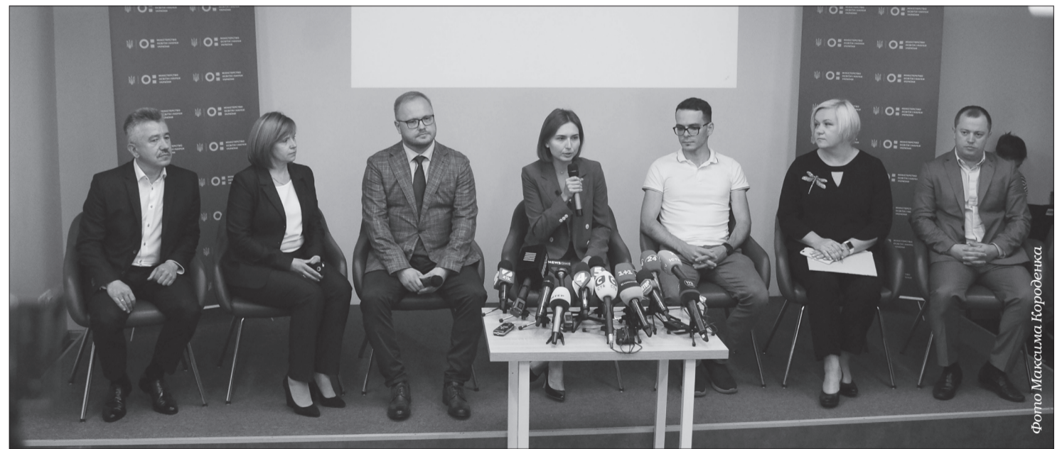
Пресконференція з нагоди представлення заступників міністра

Тимчасово виконуючий обов'язки голови підкомітету з питань науки та ін-