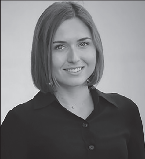
Ганна Ігорівна Новосад

У зв'язку з формуванням нового складу уряду та з початком роботи Верховної Ради дев'ятого скликання відбулася зміна керівного кадрового складу Міністерства освіти і науки України та Комітету ВР з питань науки та освіти, який тепер називається Комітет ВР з питань освіти, науки та інновацій.