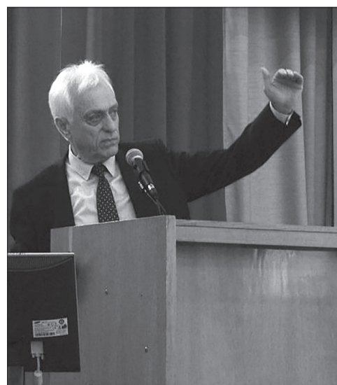
4 квітня в Національній академії педагогічних наук України відбувся ме-

тодологічний семінар «Інформаційно-цифровий освітній простір України: трансформаційні процеси і перспективи розвитку». Відкриття семінару привітав президент НАПН України Василь Кремень. Про цифрову трансформацію суспільства і розвиток комп'ютерно-технологічної платформи освіти і науки України йшлося у доповіді дійсного члена НАПН України, директора Інституту інформаційних технологій і засобів навчання НАПН України Валерія Бикова. Учасники заходу мали змогу прослухати виступи: директора Українського інституту науково-технічної експертизи та інформації Володимира Камішина («Від цифровізації науки і освіти до «відкритої науки і освіти»); дійсного члена НАПН України, першого віце-президента НАПН України Володимира Лугового («Виклики наукометрії для фахової періодики Національної