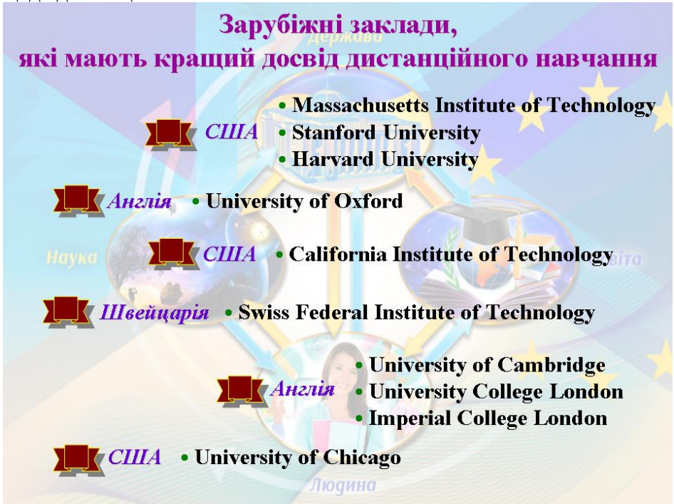
Рис. 3. Зарубіжні заклади, які мають кращий досвід дистанційного навчання

На рис. 3 – найкращі вищі заклади, досвід яких варто перейняти щодо дистанційного навчання.