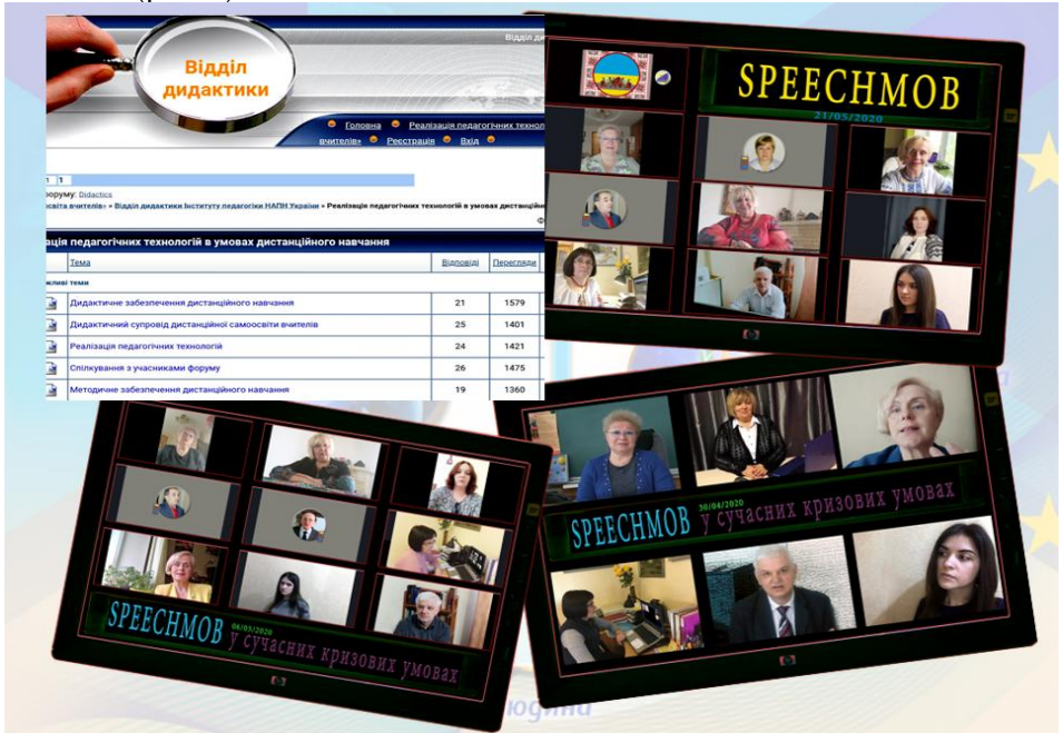
Рис. 1. Форум і Speechmob

Започаткували форум «Реалізація педагогічних технологій в умовах дистанційного навчання» [4] як ресурс для самоосвіти педагогів, розробили і впровадили нову форму соціально-наукової взаємодії під час карантину «Speechmob» [5–7], що сприяло виокремленню явищ і фактів дистанційності навчання (рис. 1).