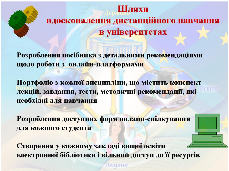
Рис. 8. Шляхи вдосконалення дистанційного навчання

Однак, я маю вказати, які можливі шляхи вдосконалення якості дистанційної освіти сьогодні і які реально здійснити у кожному окремому вищому закладі (рис. 8).