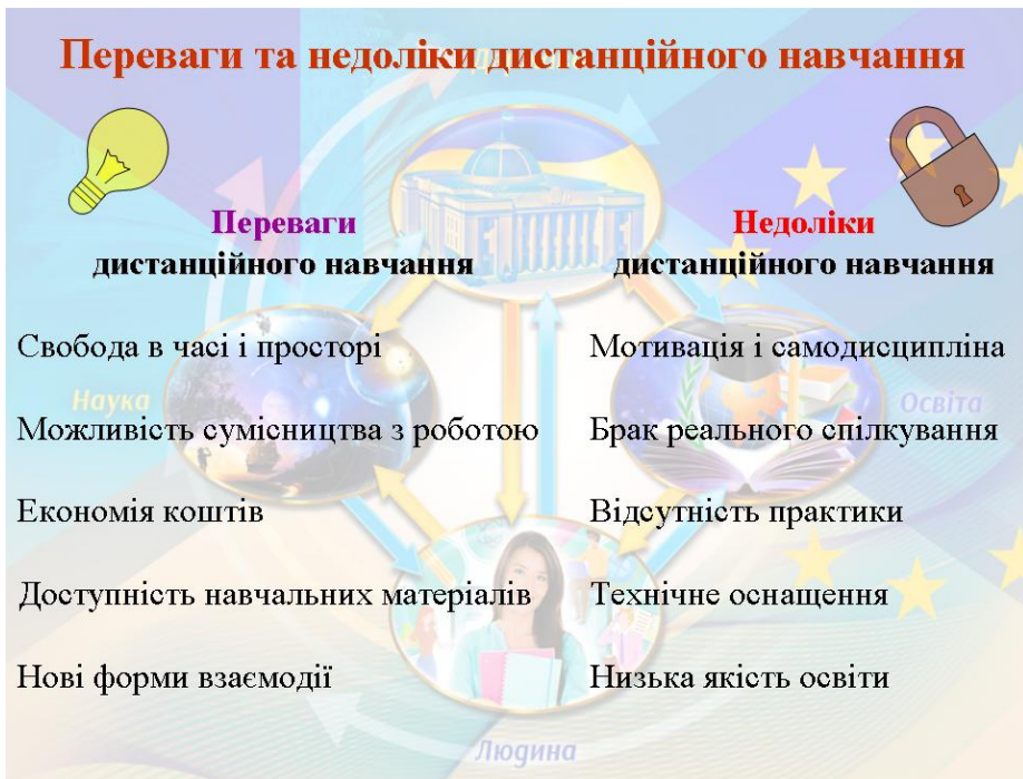
Рис. 5. Переваги та недоліки дистанційного навчання

Чому серед недоліків низька якість освіти?