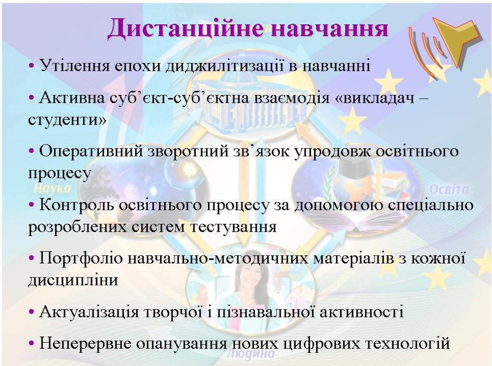
Рис. 4. Дистанційне навчання

Якщо ж узагальнити, що таке дистанційне навчання, то звернімо увагу на рис. 4.