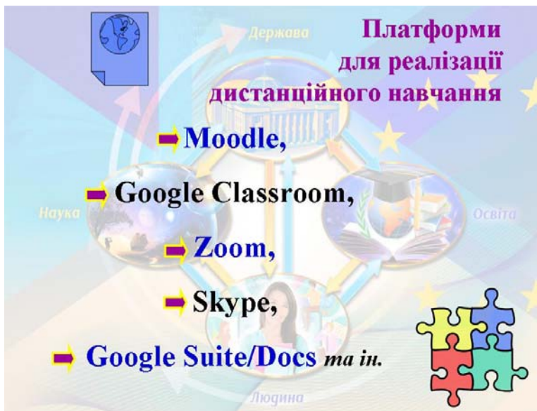
Рис. 6. Платформи для реалізації дистанційного навчання