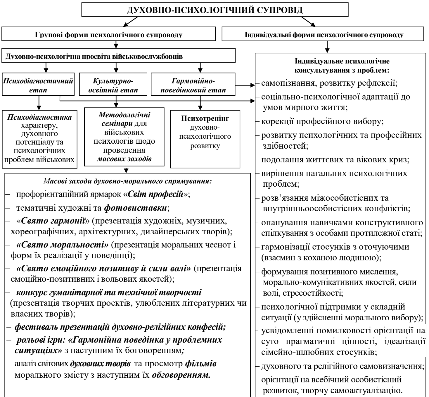
Рис. 2. Структура духовно-психологічного супроводу в системі реабілітації військовослужбовців.

Модель системи духовно-психологічного супроводу військовослужбовців представлено у вигляді схеми (рис. 2).