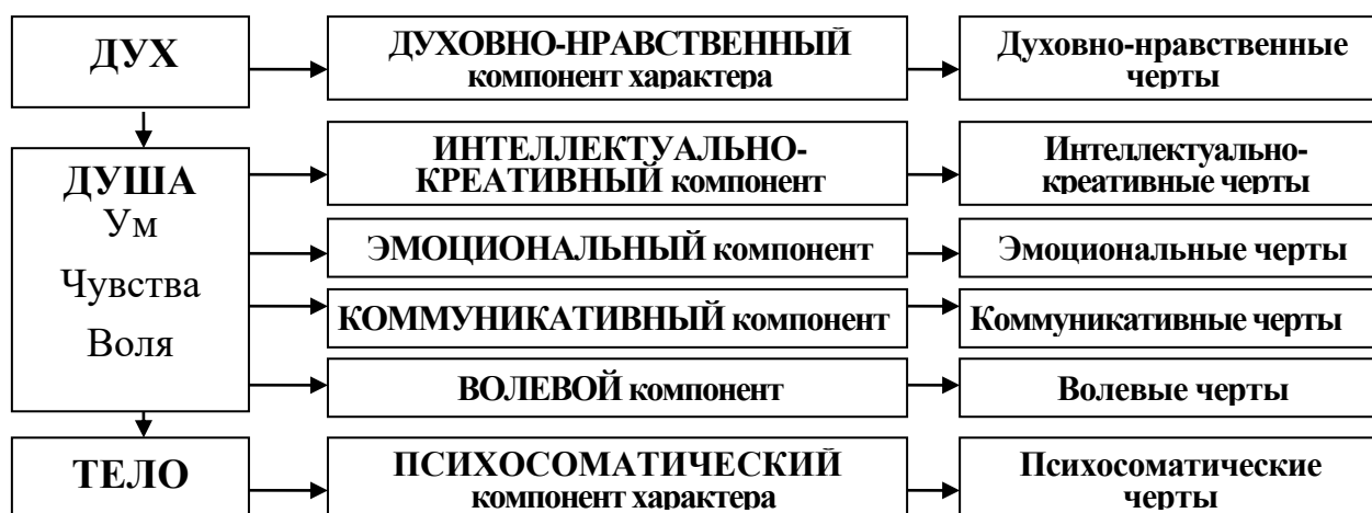
Рис. 2. Структура характера личности.

Характер имеет структуру и содержание : черты являются содержательным наполнением структуры характера. Они дихотомичны – могут быть позитивными (гармоничными) или негативными (дисгармоничными). Гармонизация характера состоит в духовном развитии всех его компонентов: ума (нравственных убеждений), чувств (любви, сострадания), воли (силы воли), нравственного общения. Когда к нравственным убеждениям присоединяется сила воли и доброе сердце, то характер становится целостным .