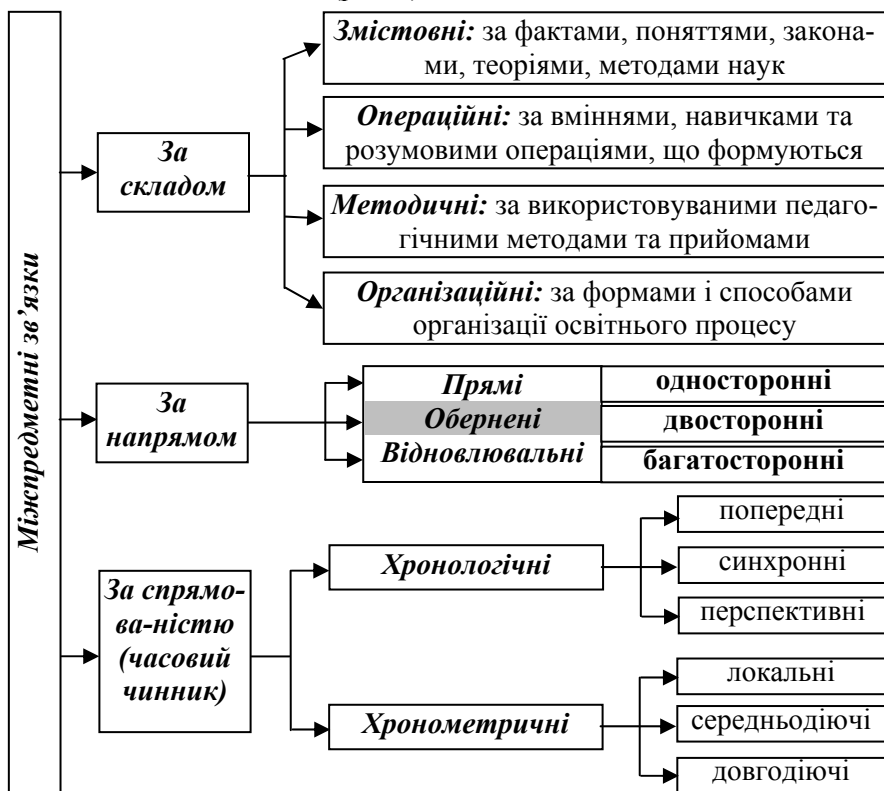
Рис. 2. Класифікація міжпредметних зв'язків

Узагальнивши праці вчених із цієї проблеми, виокремлюємо такі типи міжпредметних зв'язків: за складом, за напрямом, за спрямованістю, які, поділяються на певні види (рис. 2).