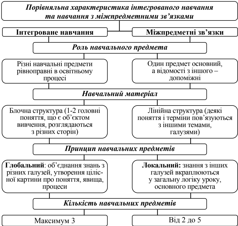
Рис 1. Порівняльна характеристика інтегрованого навчання та навчання з міжпредметними зв'язками

Порівняльна характеристика інтегрованого навчання та навчання з міжпредметними зв'язками схематично подана на рис. 1.