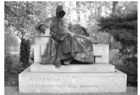
Пам'ятник Аноніму в Будапешті

Важливим джерелом, що описує набуття угорцями батьківщини є «Діяння угрів» (Gesta Hungarorum). Написане латиною, вірогідно між 1196 і 1203 роками. Автор твору невідомий, у тексті він називає себе «нотарій (писар) короля Бели», але в історичній літературі його іменують Анонім. Вперше було опубліковано у 1746 р.