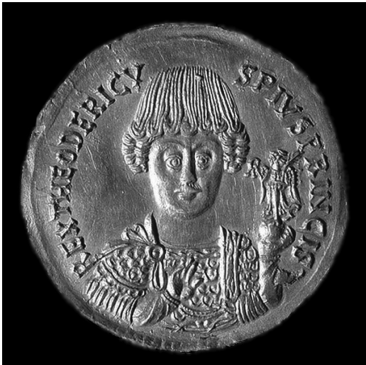
Золота монета із зображенням Теодоріха Великого

Вивчення власне перших держав Середньовіччя природно починається з варварських королівств . Попри напружені стосунки варварів і римлян, їх взаємодія виявлялася не тільки у війнах. Цікавою є доля Теодоріха – короля остготів та його радників Кассіодора й Боеції.