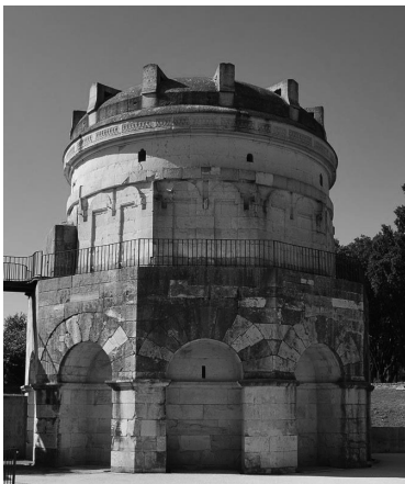
Гробниця Теодоріха у Равенні