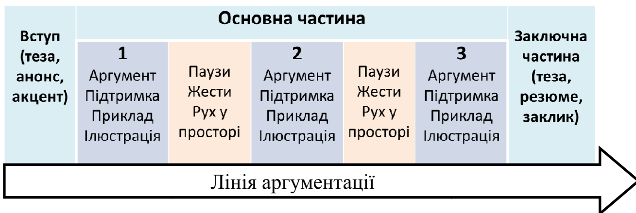
Схема 1. Лінія аргументації

Опис вправи: викладач пропонує студентам проаналізувати схему «Лінія аргументації» та пояснити, чому переконувальну промову потрібно перевірити щодо наявності в ній лінії аргументації? Студентам необхідно пояснити: навіщо аргумент має доповнюватися підтримкою, прикладом, ілюстрацією; чому необхідно передбачити вступ та заключну частини; що дають паузи, жести, рухи в просторі?