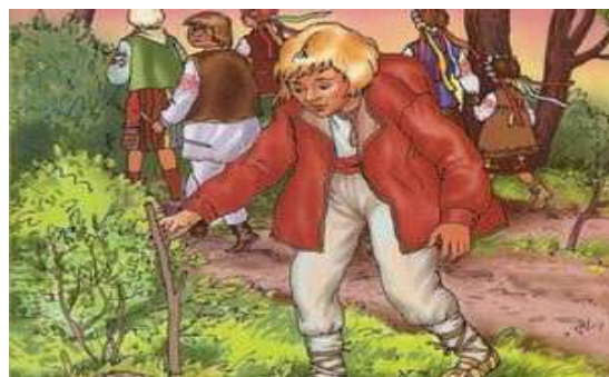
Ілюстрація до твору С. Черкасенка