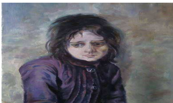
Ілюстрація до твору В. Сухомлинського «Горбата дівчинка» Маленький горбань