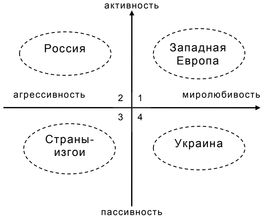
Рис. 2. Примеры разных типов национальных характеров

Так называемое сепаратистское движение на востоке страны и последовавшие за этим проявления терроризма фактически разбудило общество. Оно постепенно опомнилось и вышло из пике, куда было отправлено российской агрессией в Крыму. Начался третий этап травмы – война в Донбассе (наиболее активная фаза). Активность проявилась в росте добровольческого и волонтерского движения на фронте и в тылу, а также сопротивления информационной войне в информационном пространстве. Все это, несмотря на фактическую импотентность государства, обеспечило успех в борьбе с терроризмом.