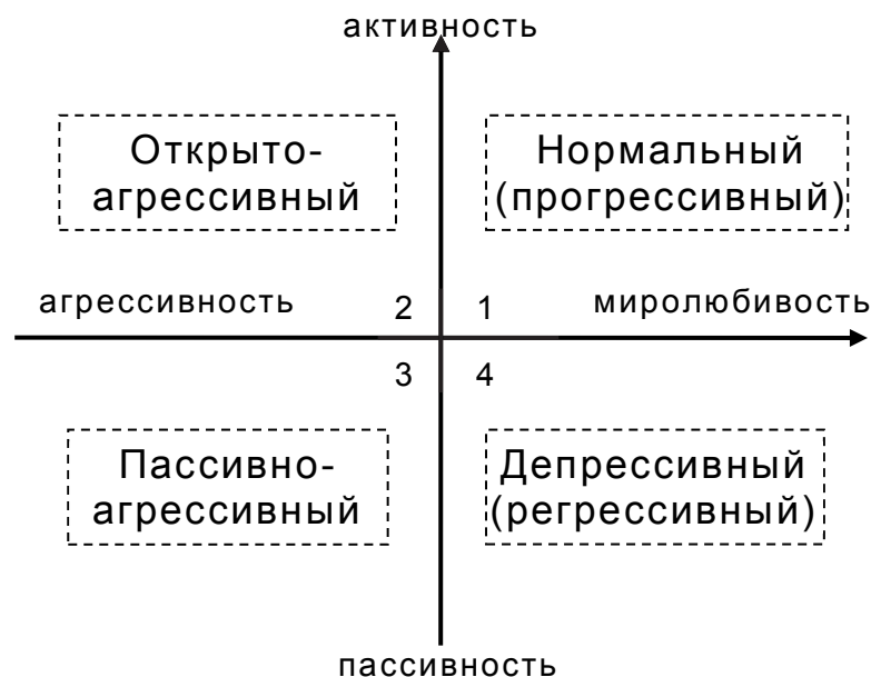
Рис. 1. Типы реагирования на травмирующий опыт, закрепленные в национальном характере

В зависимости от разных обстоятельств (тяжести травматизации и ее последствий, застревании на травме или ее вытеснении, стремлении восстановить нарушенное травмой равновесие и других) группа вырабатывает типичные формы совладания с травмой, которые закрепляются в национальном характере. Обобщая сказанное можно классифицировать типы такого реагирования на травмирующий опыт, используя два параметра: активность-пассивность и миролюбивость-агрессивность (рис. 1).