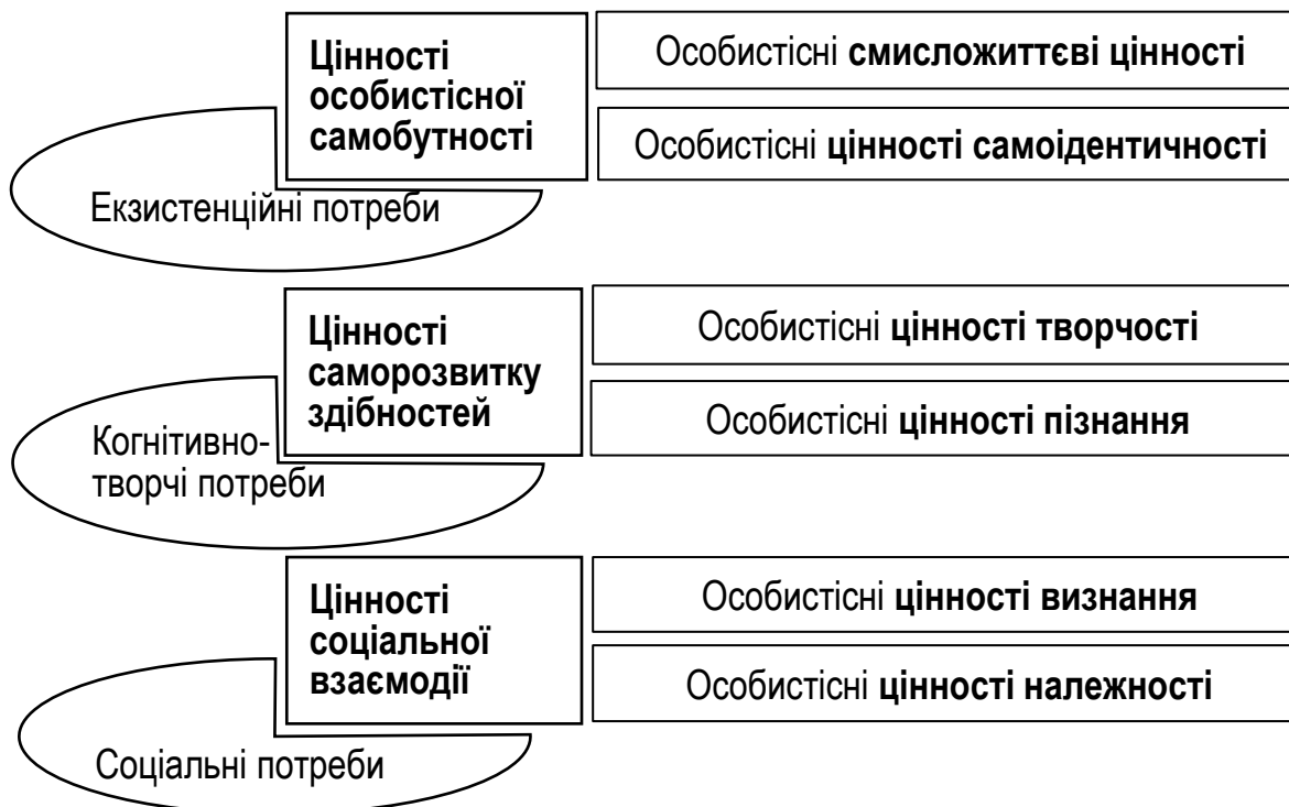
Рис. 2. Класифікація особистісних цінностей обдарованої людини з позицій потребового підходу

Для дослідження аксіогенезу обдарованої особистості важливо зацентувати увагу на тих особистісних цінностях, які пов'язані саме з розвитком обдарованості. У проведених раніше дослідженнях нами було виокремлено три групи потреб, які виконують особливу роль в аксіогенезі та мають специфічне наповнення в обдарованої особистості: соціальні, когнітивно-творчі та екзистенційні потреби [5]. У процесі задоволення цих потреб формуються особистісні цінності, класифікацію яких наведено на рис. 2.