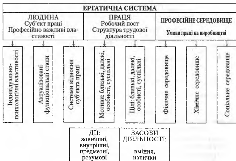
Рис. 2. Ергатична система

Реалізація системи «людина – праця» потребує врахування сукупності об'єктивних і суб'єктивних чинників, що постійно взаємодіють і впливають на ефективність цієї системи, її життєдіяльність і гнучкість. Логічна схема цього процесу, опрацьована українським психологом О. Баклицьким й модифікована нами, свідчить про динамічність прямих і взаємозалежність зворотніх зв'язків. У цьому процесі в праці людини відбуваються якісні зміни під впливом інновацій, ускладнення професій, їх інтегрування, впровадження результатів наукових досліджень, нових вимог роботодавців в умовах динамічних змін на міжнародних і національних ринках праці.