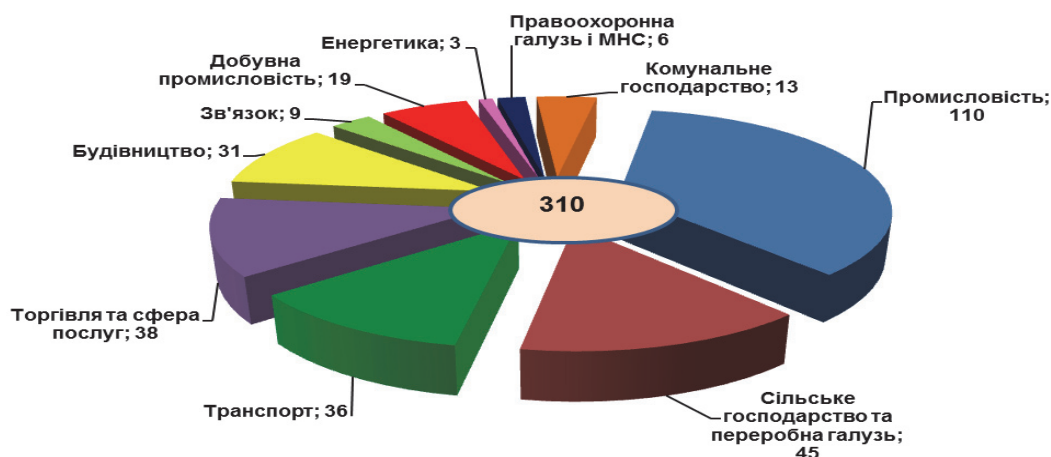
Рис. 1. Державні стандарти, розроблені у 2010–2014 роках

Залежно від бажання вступника, типу навчального закладу, потреб ринку праці, рівня кваліфікації, створюються умови для здобуття неперервної освіти з поєднанням загальноосвітньої підготовки, отримання професійної освіти з кількох виробничих професій. З метою забезпечення якісної підготовки робітничих кадрів, дотримання єдиних вимог щодо запровадження в Україні Міжнародної стандартної класифікації освіти у 2010–2014 роках розроблено та впроваджено у навчально-виробничий процес 310 державних стандартів професійної освіти з конкретних робітничих професій (рис. 1).