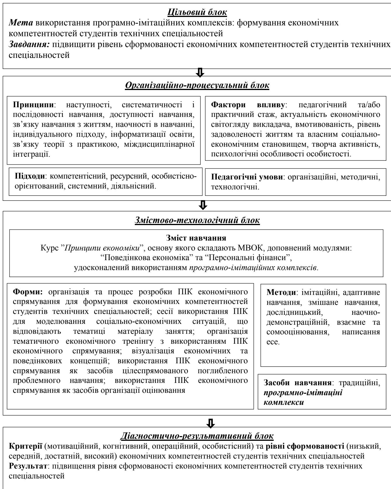
Рис. 1. Модель використання ПК як засобів формування економічних компетентностей студентів технічних спеціальностей

Розглянуто та описано різні форми та методи використання програмно-імітаційних комплексів для формування економічних компетентностей студентів технічних спеціальностей: організація та процес розробки програмно-