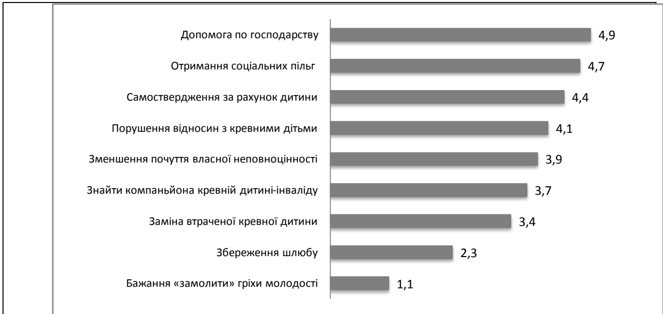
Рис. 2. Рейтинг деструктивно-негативних мотивів усиновлення (у %)

Всі ці мотиви носять негативний характер, оскільки вони не слугують підтримці перспективного розвитку сім'ї, а спрямовані або в минуле (своє чи дитини) або на отримання певної компенсації.