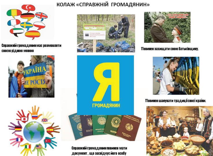
Рис.3. Типовий колаж «Справжній громадянин»

Емоції та почуття. Відсутність віри у майбутнє країни, зневага до інших людей та державних символів, користоловство.