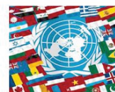
Демократія та свобода