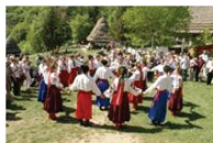
Шанс традицій, вивчає історію