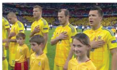
Справжній українець має знати гімн своєї країни