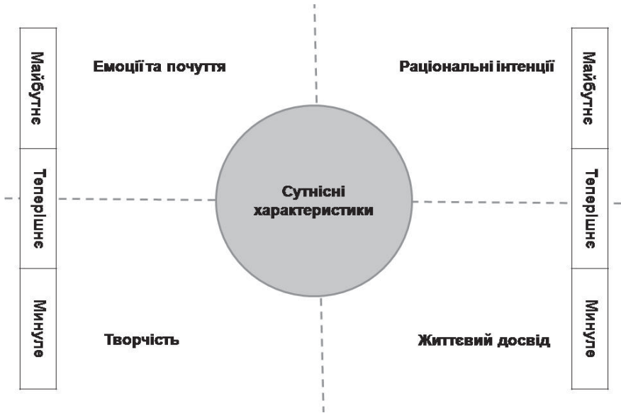
Рис.1. Схема базових елементів інтерпретації колажів за методикою «Географія візуальних образів».

Аналіз результатів емпіричного дослідження. Зазначена методика разом з розробленою інтерпретаційною схемою була використана нами в межах емпіричного дослідження психосемантичних особливостей національної та громадянської ідентичності студентської молоді.