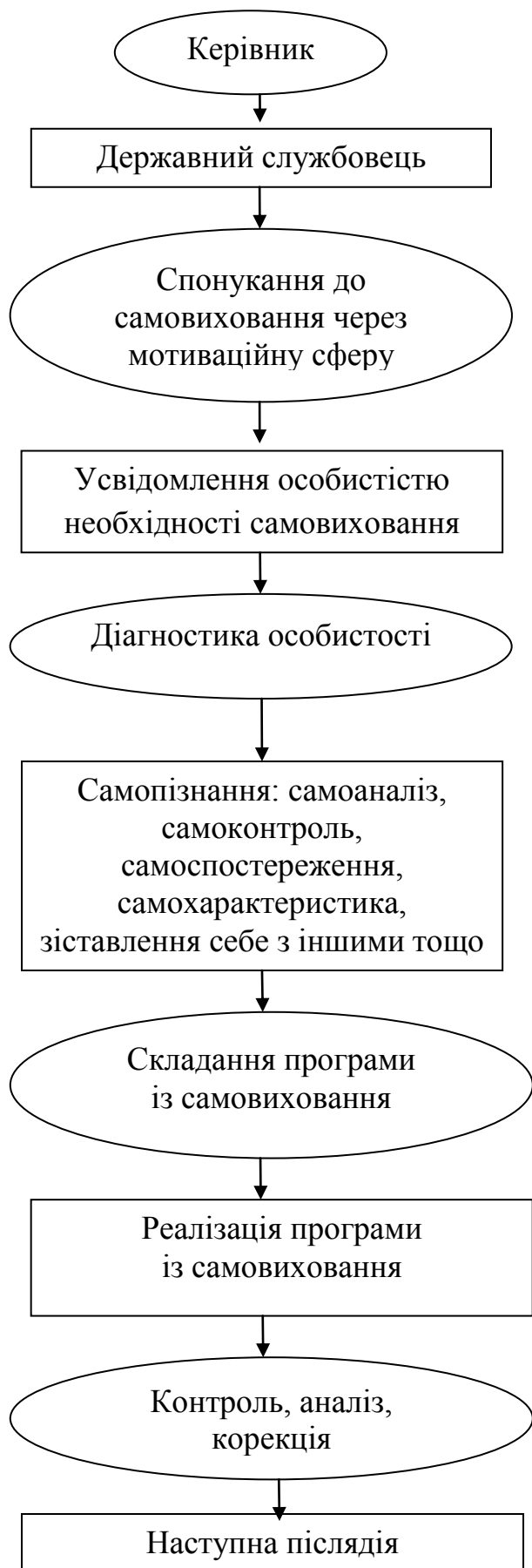
Рис. 2. Педагогічна допомога із самовиховання